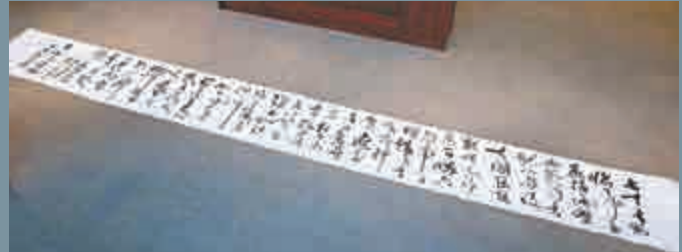
▲草書手卷《切膚吟》