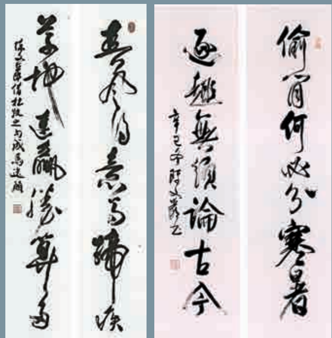
▲草書對聯：春風得意馬蹄疾 草地連羸勝算多 逐趣無須論古今 文：大公報記者 周婉京