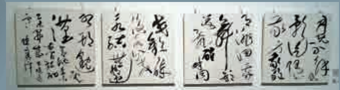
▲「心聲墨跡」展覽現場展出草書四聯屏