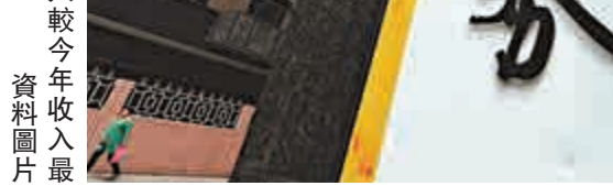
高的一月券業佣金收入較今年收入最高的六月縮半 資料圖片

業內人士指，由於股指期貨成交量出現爆發性增長，期貨公司的風險管理、資管產品等創新業務開始顯效。上市券商業務公司背靠實力強大的股東，拓展創新業務具有得天獨厚的優勢，因此上半年期貨公司營業收入大幅增長。