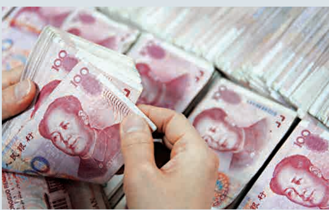
▲分析指，財政部此次設PPP基金，不僅僅提供資金，還引領地方政府改變觀念，代表管理層對於前期工作的重視，減少PPP項目的失誤

自財政部今年6月末表態稱，將研究設立PPP融資支持基金，加快項目實施的進度及可融資性。財政部上月就已與幾大金融機構進行溝通，將聯合設