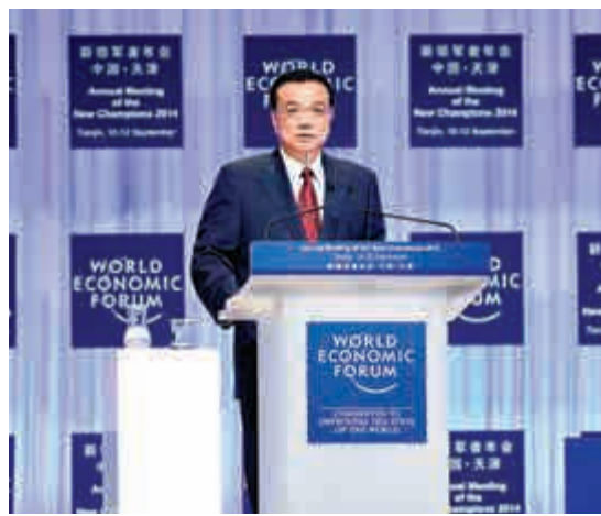
▲國務院總理李克強去年出席2014夏季達沃斯論壇開幕式並致辭 資料圖片

從2007年開始，世界經濟論壇每年9月在中國召開「世界經濟論壇新領軍者年會」又稱「夏季達沃斯年會」，重點關注正在改變新興跨國企業與高增長經濟體的全球、地區和行業問題。新領軍者年會重點探討下一代領袖的各種觀點，他們正在深刻影響未來的商業模式、可持續發展戰略以及技術創新。