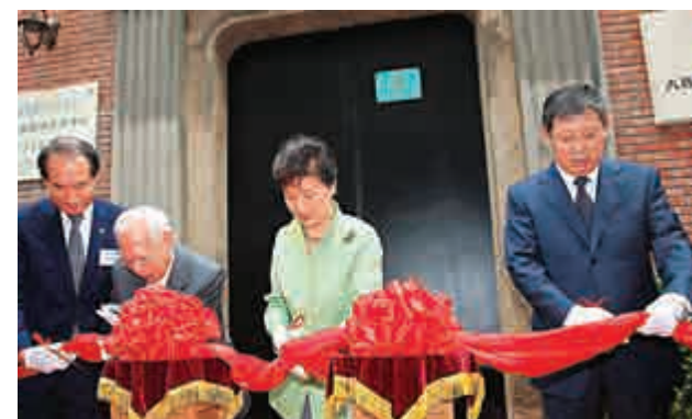
▲4日，韓國總統樸槿惠（右二）等嘉賓為上海「大韓民國臨時政府舊址」展館更新啓用剪綵 新華社