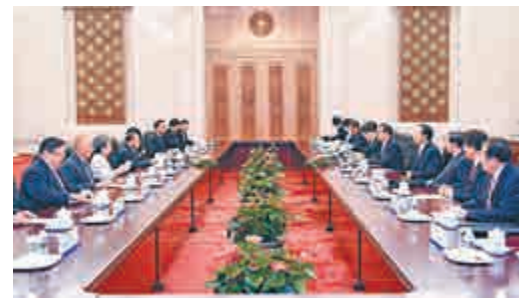
▲4日，國務院總理李克強在北京會見泰國第一副總理兼國防部長巴維

【大公報訊】據中新社報道，中國國務院總理李克強4日上午在人民大會堂會見來華出席中國人民抗日戰爭暨世界反法西斯戰爭勝利70周年紀念活動的泰國第一副總理兼國防部長巴維。