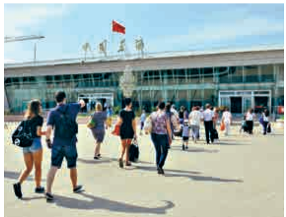
▲俄羅斯遊客進入黑河口岸

廣東省商務廳副廳長吳軍指出，中俄兩國將充分利用廣東省作為「一帶一路」海陸連接點的優勢，發揮各自所長並採取聯合行動，推動中俄貿易產業園合作建設和持續發展，將其打造成為提升中國與俄羅斯聯邦密切合作的重要平台。其中，廣東省政府為項目的建立實施以及持續發展提供必要的政策支持，推動廣東企業與俄羅斯企業之間的互動對接。