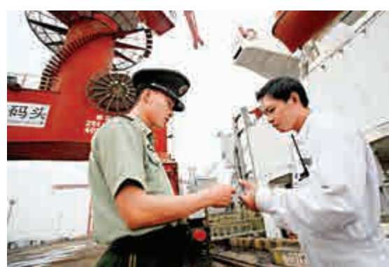
▲《貿易便利化協定》有助中國營造便捷的通關環境。圖為江蘇太倉邊檢站一名戰士在檢查出入境證件

【大公報訊】據中新社報道，中國商務部4日晚間宣布，中國4日正式完成接受《貿易便利化協定》議定書的國內核准程序，成為第13個接受議定書的成員。