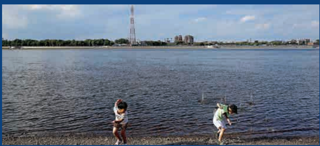
▲兩名中國小童在黑龍江河邊玩耍，背景是俄羅斯布拉戈維申斯克市