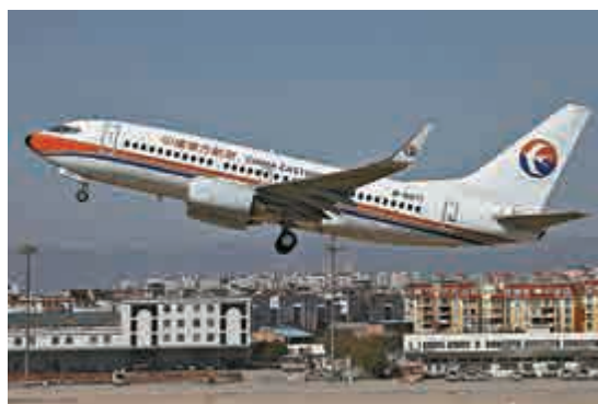
▲澳航將與東航共同打造歷史上最大的航空聯盟

經過多方協調，ACCC終於同意有關協議，但提出雙方在中澳航線上未來五年需要增加21%的運力，並且需要按照具體的航線按月向ACCC報備平均票價。儘管目前合作細節尚未公布，但考慮到合營後的運力增加、航線網絡完善和票價管制，此次合作有望進一步提升其國際航空樞紐的地位。