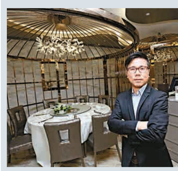
發展馬來西亞「金爸爸」品牌，持股56%。

目前，唐宮中國在內地設有57間食肆，除了以「唐宮」為主打品牌，集團分別5年前開發簡餐業務，包括在2010年取得沿自於日本的「胡椒廚房」在上海、北京及天津的特許經營權，又於2012年以合資形式