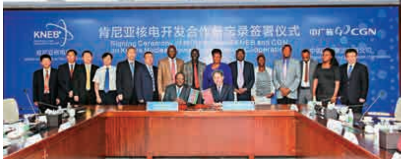
▲中國廣核集團昨日與肯尼亞能源與石油部下屬的核電局簽署核電開發合作的諒解備忘錄

肯尼亞現有電力裝機容量約200萬千瓦，村電網覆蓋率僅10%，全國僅30%。根據肯