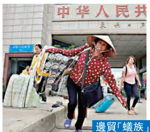
邊貿「蟻族」 每天都有大量邊貿「蟻族」穿梭廣西和越南之間。圖為一名越南邊民背着中國商品經廣西東興口岸出境回國銷售。