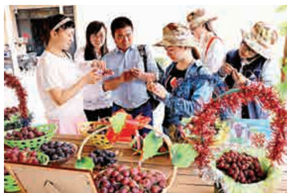
▲遊客在優質葡萄酒展銷會上品嚐敦煌葡萄酒

已經在青海進行試觀測的SONG望遠鏡，有諸多「高大上」配備，如高分辨率光譜儀、幸運成像相機等，使得科學家能夠通過恆星「震動」光譜數據研究恆星內部。同時，百分之一甚至千分之一秒「抓拍」的10萬張照片中，約百張清晰大圖能夠提供「老年恆星」的「臉譜」。