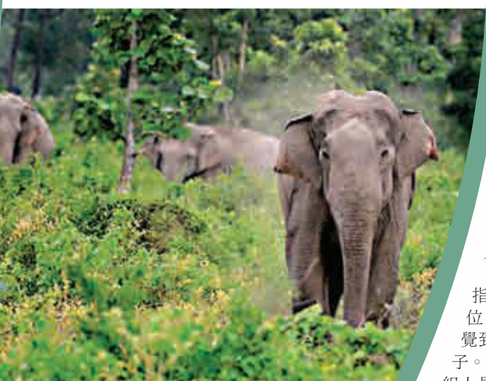
▲一名中國工程師在印度被野象踩死

據悉，在森林茂密的恰蒂斯加爾邦北部，人象衝突是出了名的。過去幾年，當地目睹了幾起村民被野生大象踩死的案例，房子受到破壞，農作物被踐踏。