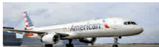
▲受害者父母入稟法院控告美國航空

根據受害女童的父母提交上法庭的文件指出，他們的女兒當日單獨乘機，旁邊是空位。飛行途中，女童睡着了，但突然驚醒，感覺到有人撫摸身體，而旁邊的空位坐了一名男子。女童趁男子去洗手間之際通知機組人員，機組人員安排她改坐頭等艙空位。客機降落后，警方登機帶走該名男子。