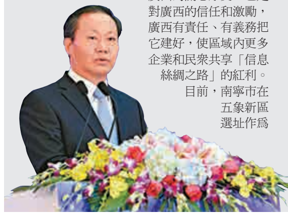
▲廣西自治區書記彭清華在論壇開幕式上致辭

集策區域，打造中國—東盟信息港南寧核心基地。南寧市已篩選34個項目作為核心基地的重點項目，總投資約209億元人民幣。