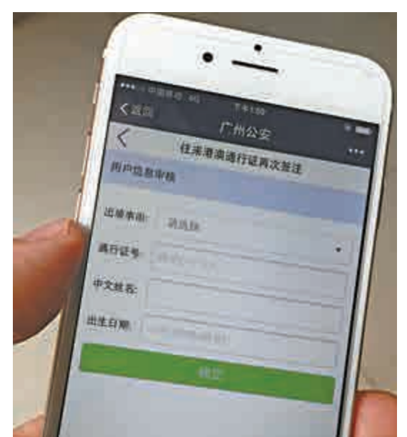
▲廣東赴港澳再次簽註通過「微信」即可辦理

其中，赴港澳再次簽註以後無需再苦尋公衆服務號，只需「微信」掃一掃「往來港澳通行證」封面，即可在線上續簽和支付，無需再去辦證大廳