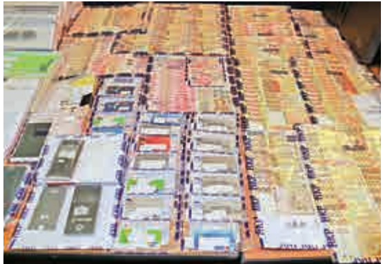
▶行動中檢獲的現金及大批入數卡 大公報記者周慶邦攝