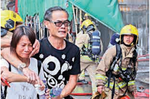
▲深水埗音響及珠寶店遭火焚毀，店東夫婦哭成淚人

【大公報訊】深水埗欽州街一間準備搬遷音響珠寶店，昨下午懷疑有人舖內燒焊，火屑意外燃着舖內的隔音棉，火勢一發不可收拾，現場冒出濃煙及大火，消防員到場開喉灌救逾半小時將火撲熄，店舖已付諸一炬，店東夫婦兩人初步點算損失達三百萬元，兩人哭訴店舖搬遷在即，卻突然「一把火燒晒」悲從中來。