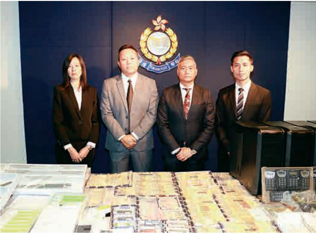
▲警方O記反黑及打擊非法借貸行動，展示搜出的現金及證物