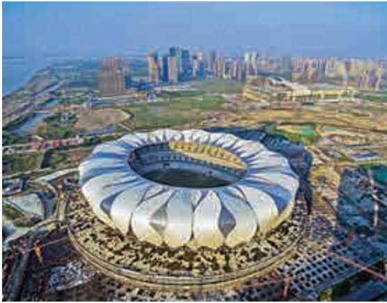
▲16日，杭州奧體中心主體育場外牆的金屬花瓣已建設完成