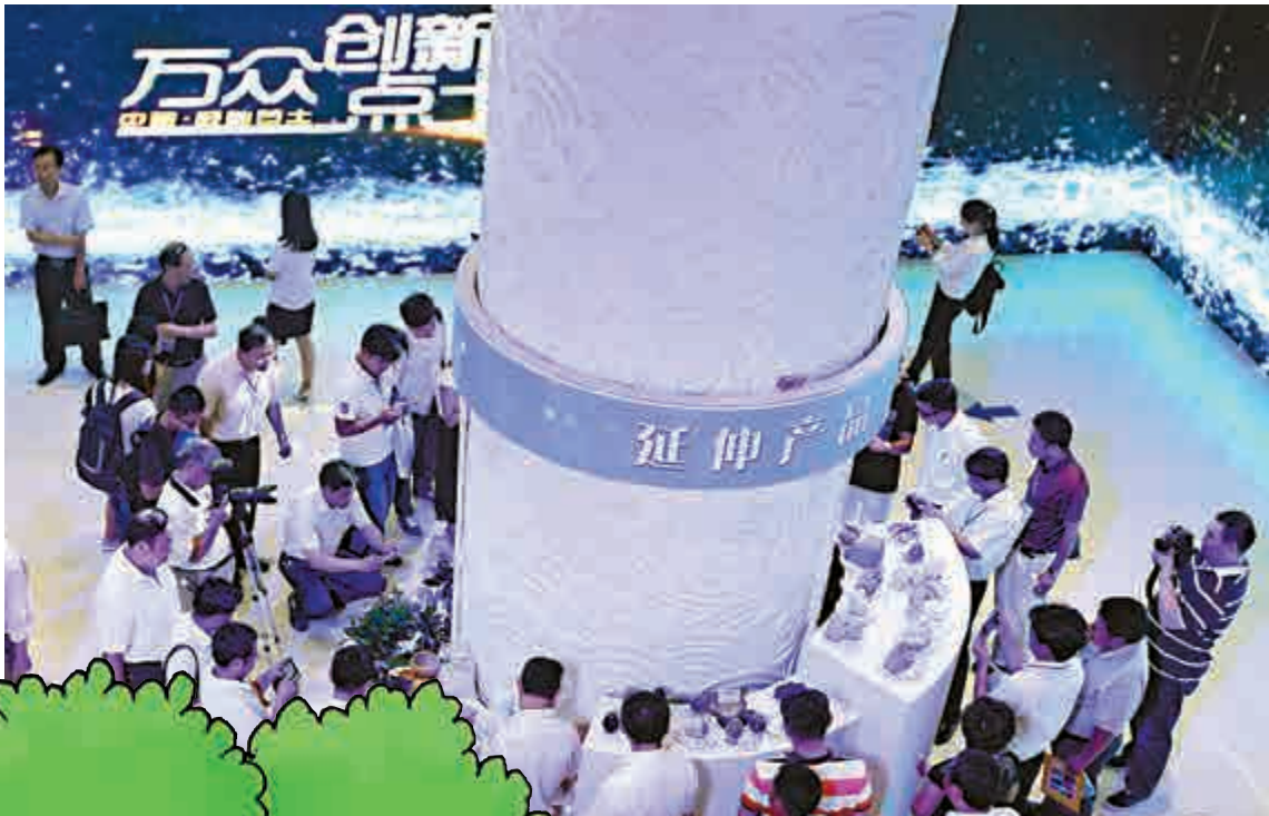
▲國務院認為要發展眾創空間和網絡眾創平台，吸引更多參與創新創造 資料圖片

三要加強統籌規劃，以投融資、貿易便利化等改革推動區域協同發展和產業轉移承接，打造新的增長點。