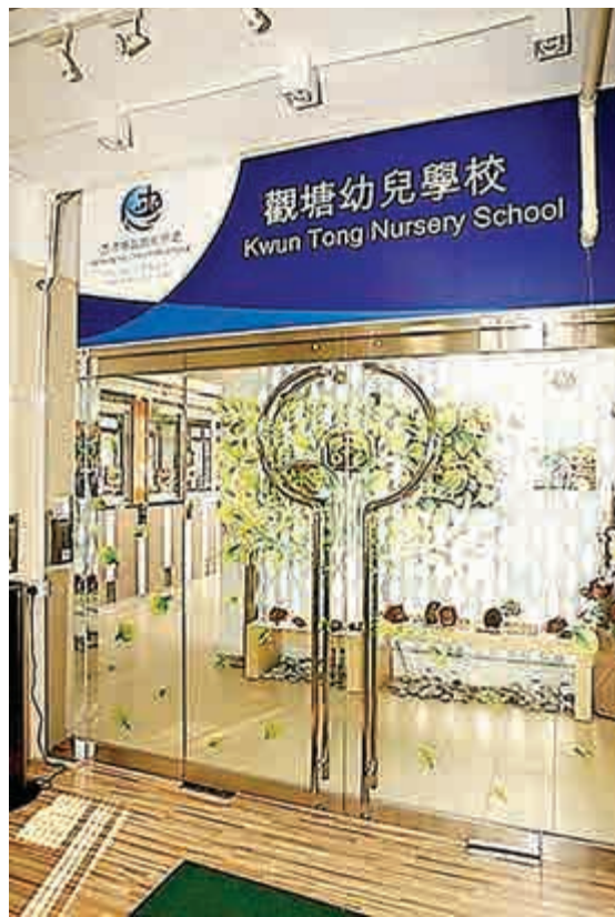
▲政府驗出香港基督教服務處觀塘幼兒學校水辦含鉛量超標，是首次有幼稚園中招 學校網頁

水爐並非供食水予學生及教職員飲用，政府會開會核實有關資料，假如屬實，未必有需要安排學生驗血。他補充，教育局正為不同幼稚園驗水，暫時只有一間幼稚園驗出水樣本含鉛量超標，會繼續密切關注結果。