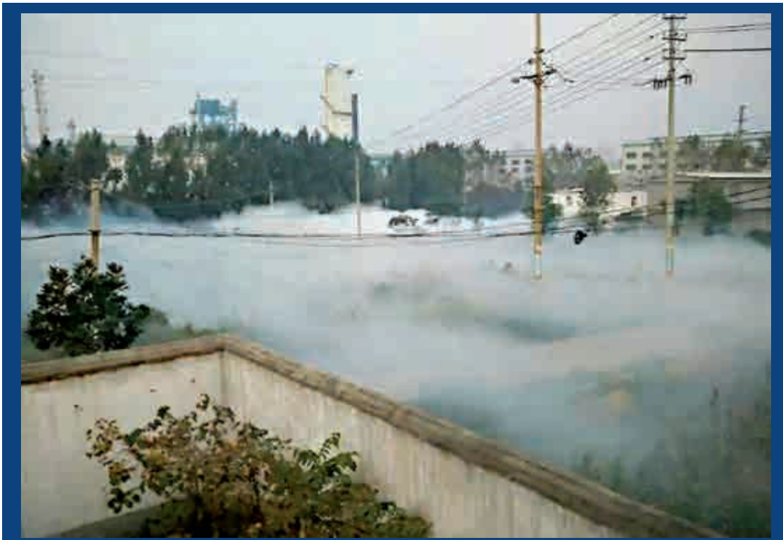
▲氨氣泄漏後附近村莊白茫茫一片

據悉，氨氣主要經呼吸道吸入中毒，對人體的毒性與環境中氨的濃度及接觸時間有關。輕度接觸者會流淚、咽痛、聲音嘶啞、咳嗽，同時可能伴隨頭暈、胸悶、噁心嘔吐等症狀。重者可能出現上呼吸道黏膜化學性炎症及燒傷、肺充血、肺水腫及出血甚至昏迷、休克。