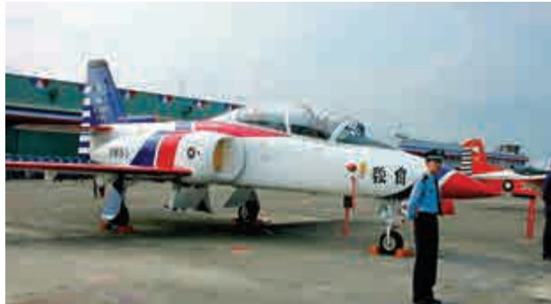
▲台灣空軍司令部22日證實，空軍官校1架AT-3教練機失聯。圖為這架教練機先前提出照片

【大公報訊】據中社社報道：台灣空軍官校一架AT-3教練機22日執行訓練任務時失聯，機上有一名學員及一名教官。目前尚未尋獲飛機及機上人員，失聯原因待調查。