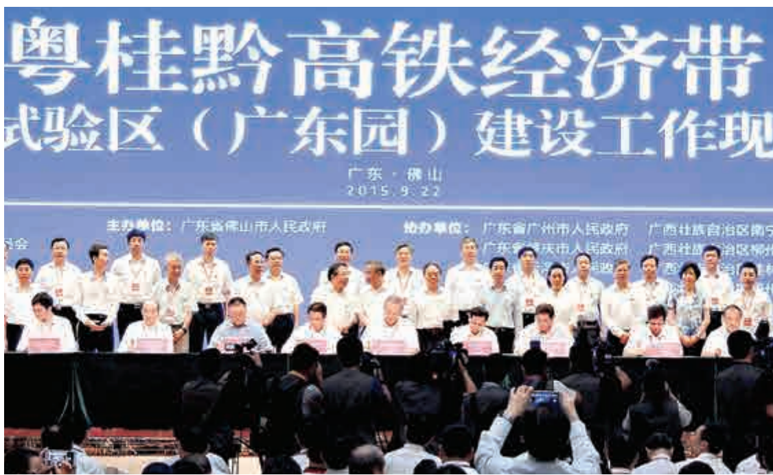
▲22日，粵桂黔高鐵路經濟帶合作試驗區（廣東園）建設工作現場會在佛山市召開

據介紹，此次簽約的項目從產學研、金融、產業等多個方面保障「粵桂黔高鐵路經濟帶合作試驗區」的建設。由港資基金管理公司負責籌集廣東金融高新技術服務區管委會，簽約共同發起100億元的「粵桂黔高鐵路經濟帶產業發展投資基金」。該基金將優先投資於經濟帶合作試驗區核心區基礎設施建設項目。