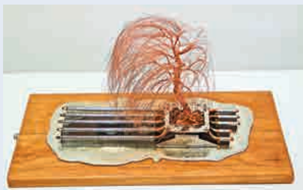
▲林佑森作品《銅林之二》