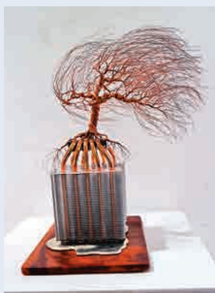
▲林佑森作品《風起了之二》 大公報實習記者卡卡未攝