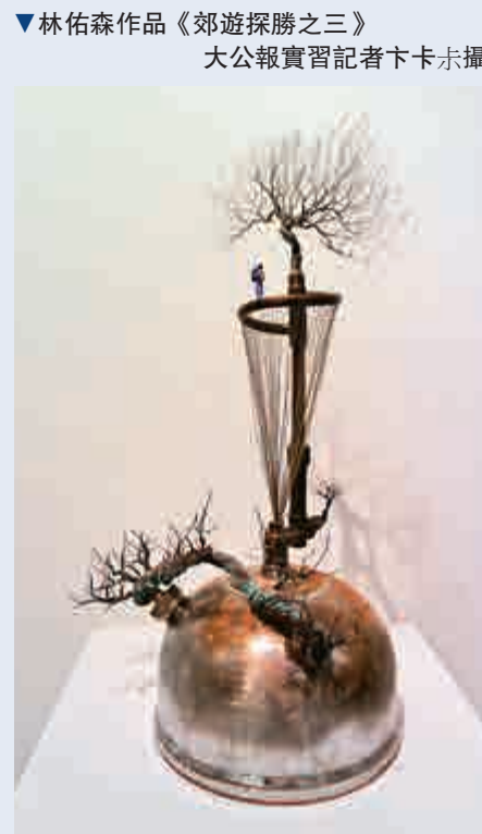
▲林佑森作品《郊遊探勝之三》