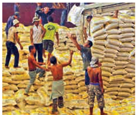
▲九七金融風暴的源頭是泰國，現在亞洲國家的經濟能力都比過去強得多

■ 1997年以來，亞洲地區簽訂多邊貨幣互換協議，有助管理短期流動問題。同時，不少亞洲經濟體在網上發布有關貨幣動向報告，控制財務政策，增加了透明度。