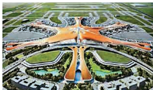
▲北京新機場意見確定「海星」設計方案 網絡圖片