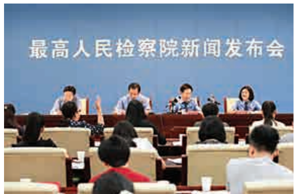
▲23日，最高人民檢察院召開新聞發布會

「將三個方面加大力度打擊金融犯罪。」聶建華表示，一方面將進一步加強金融犯罪相關法律適用問題的研究，另一方面將探索建立金融違法犯罪的行政執法與刑事司法銜接的機制。此外，將建立高度責任感和豐富辦案經驗的防範和懲治金融犯罪專業檢察隊伍，探索成立專門金融檢察部門或者金融檢察專業辦案組，不斷提高辦案人員的金融知識水平和業務能力。