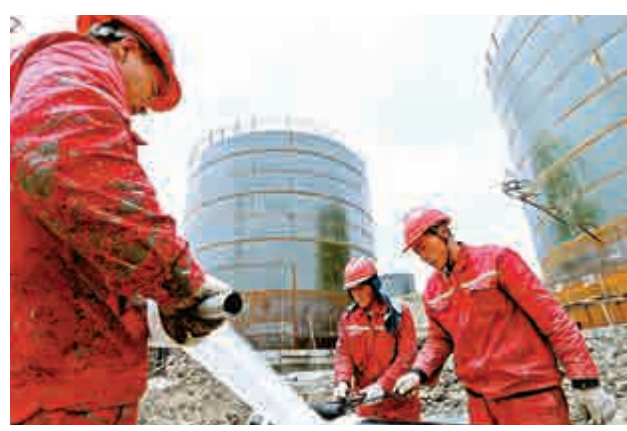
▲國資委官員稱，全民屬性是國企改革的關鍵。圖為中石油工人在西藏那曲油庫改造施工現場工作

至於檢察機關預防此類犯罪的措施，聶建華稱，一是進一步加大對金融犯罪案件追訴、制裁、打擊力度；二是加強懲治金融犯罪的宣傳和預防金融犯罪防範的普法教育，針對犯罪易發環節通過案例警示、風險提示、專項教育等方式開展犯罪預防工作；三是加強與金融監管機構溝通合作，在辦案過程中發現監管問題和程序上的漏洞及時與監管部門溝通反映情況，敦促有關主管部門完善監管的措施。