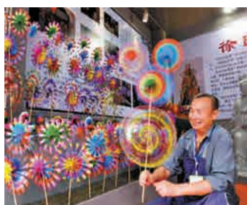
▲成都國際非遺節近日開幕，風車勾起了兒時回憶

雋倫表示，培訓可以補非遺傳承人羣文化修養之缺、美術基礎之缺、設計意識之缺、市場意識之缺；通過培訓幫助非遺傳承人羣發現生活之美、傳統工藝之美，並學會將美帶入作品、帶進生活。