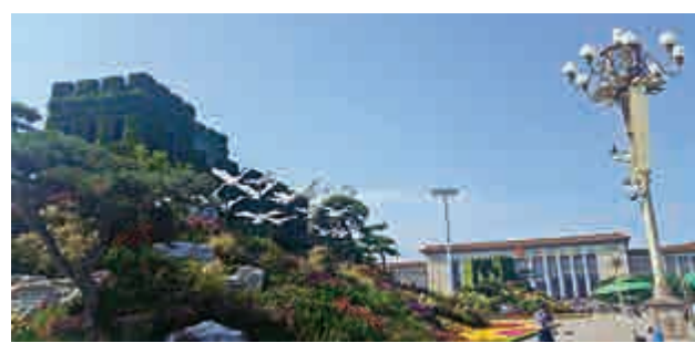
▲「9·3長城主題花壇」與大花籃交相輝映