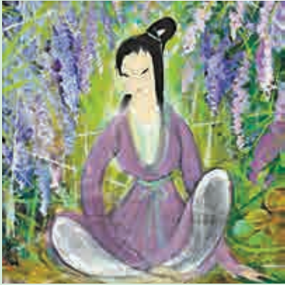
▲林風眠以喜歡的仕女畫題材創作《人在花叢中》

改，他指着今次將展的徐悲鴻《五駿圖》介紹：「這幅作品作於一九四二年，當時徐悲鴻經緬甸返中國，取道入滇，暫居雲南大學，他在校期間，為抗日勞軍展創作這幅《五駿圖》。徐悲鴻取六尺整紙，繪五駿齊奔，以