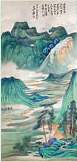
▲張大千「沒骨」法繪《蜀山春曉》

該展將於下月二至六日在香港會議展覽中心展覽廳三舉行，查詢展覽詳情可瀏覽蘇富比網址：www.sothebys.com。