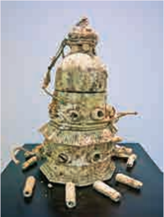
▲裴公慶作品《堡壘寺》海水浸沒前（左）與海水浸沒後

【大公報訊】越南藝術家裴公慶（Bui Cong Khanh）新作展覽「堡壘寺（Fortress Temple）」正於中環10號贊善里畫廊舉行，藝術家將物料、概念、視覺元素融合，展示出「藝術可以超脫本身地域，在不同的地區及時空延伸下去。」並鼓勵觀者與藝術家一同評論及解讀當代生活與政治。