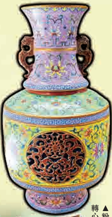
▲粉彩鏤空團螭龍紋「時時報喜」轉心瓶，乾隆時期