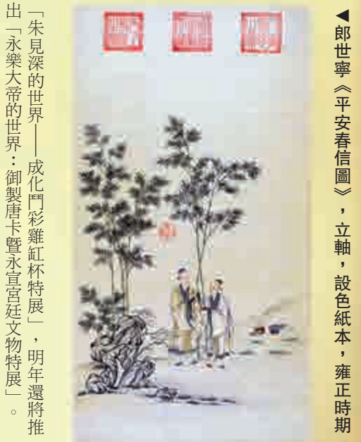
▲郎世寧《平安春信圖》，立軸，設色紙本，雍正時期

第二部分，顧名思義是介紹三人治下都關注的一個問題：開疆拓土。從康熙時代的平定三藩、統一台灣、驅逐沙俄、安定西藏，到雍正朝的西征青海、改土歸流，及至乾隆皇帝的十全武功，平定西域，中國形成今天如此廣闊的疆域、多元化的民族、如此統一的文化認同。從這一點出發，我們可以從書畫到器物等各類藝術品洞悉一種共同氣質：空前的皇權。無論是乾隆帝的紫壇寶座還是寶刀，以及乾隆八年的編鐘、各類象徵皇權的御璽，都呈現出一