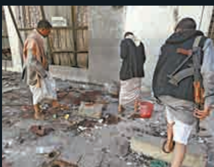
▲ 也門胡塞武裝24日檢查遭受炸彈襲擊的清真寺

今年以來，「伊斯蘭國」武裝人員在薩那實施多起針對胡塞組織的自殺式爆炸襲擊，已造成近200人死亡。