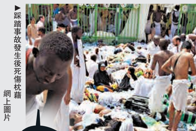
▲ 沙特救援人員24日抬走踩踏事故傷者 ▲ 踩踏事故發生後死傷枕藉

【大公報訊】據美聯社報道：來自世界各地的穆斯林朝聖者，在周三傍晚前聚集在沙特阿拉法特山的山谷裡。他們將在那裡舉行長達一天的禱告儀式，這是伊斯蘭教一年一度的朝聖巔峰。近兩百萬朝聖者將在那裡肩並肩度過感性的一天。不少朝聖者將雙手伸向空中，眼中飽含淚水，他們為所愛之人祈福，也請求真主原諒自己曾犯下的錯誤。