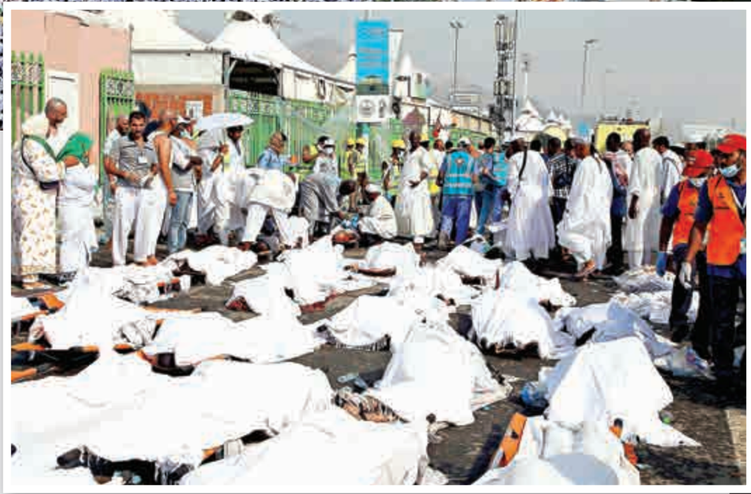
▲ 踩踏事故遇難者屍體被白布覆蓋，暫放在街上