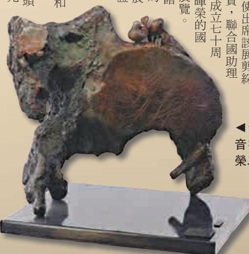
▲青銅雕塑《鳥音禪意》，蕭暉榮二〇〇九年作