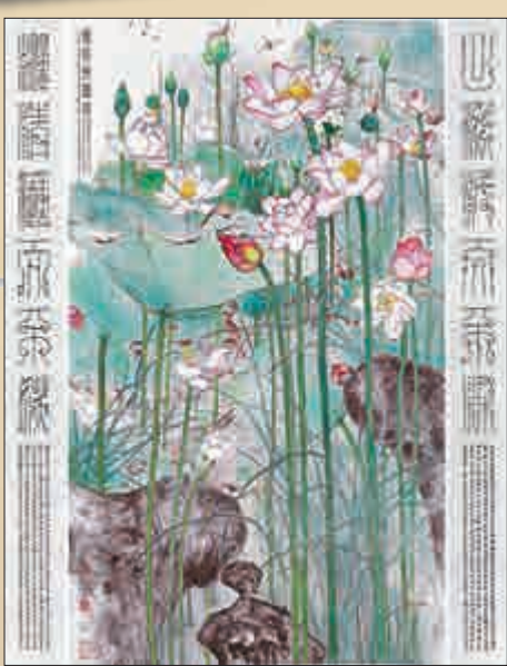
▶《池面好豐神》，蕭暉榮二〇一四年作