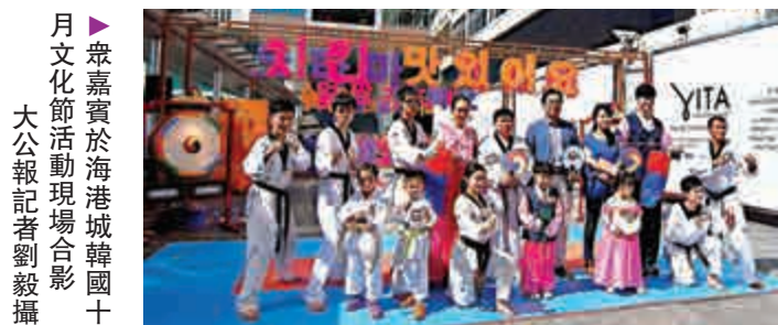
▲韓嘉賓於海港城韓國十月文化節活動現場合影

「韓國十月文化節」由大韓民國駐香港總領事館、大韓民國外交部及文化體育觀光部合辦。查詢以上活動詳情可電二一八八六六。