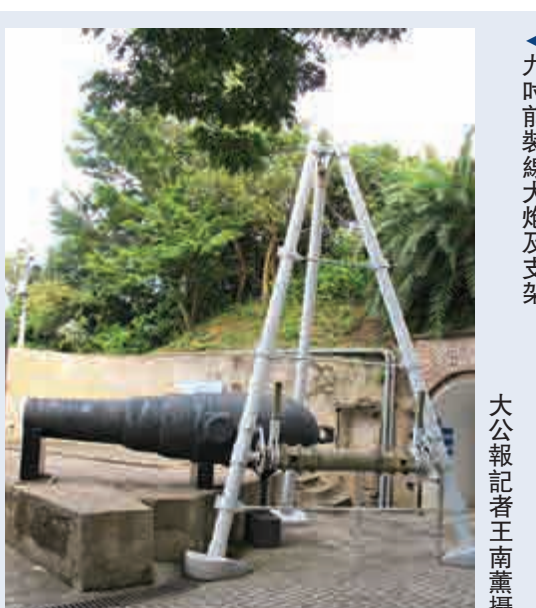
▲九吋前裝線大炮及支架