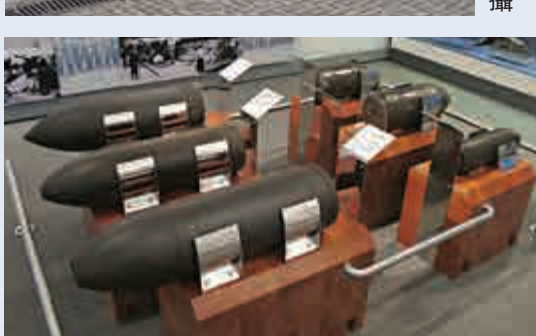
▲不同時期的穿甲炮彈