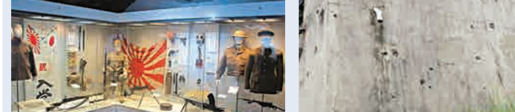
▲軍營殘跡的磚牆上滿布子彈和炮彈的痕跡