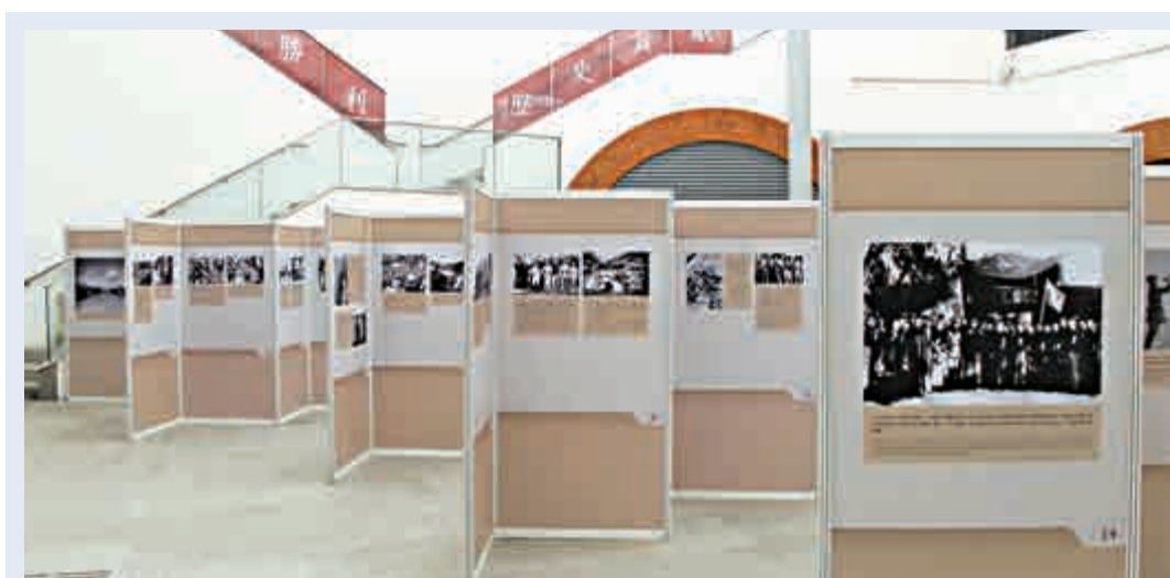
▲「偉大勝利 歷史貢獻」圖片展現場