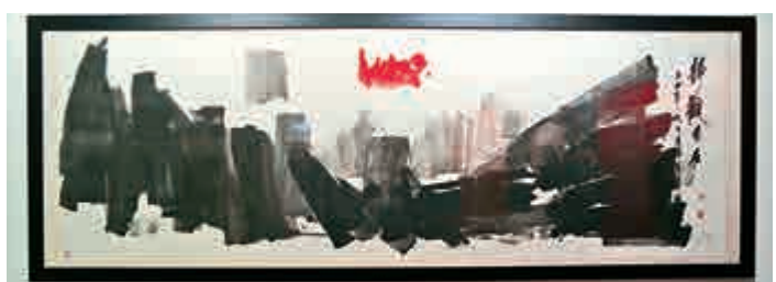
▲呂壽琨作品《靜觀自在》

該展覽於港島筲箕灣東喜道175號香港海防博物館堡壘大堂展至下周三。查詢詳情可電二五六一五〇〇，或瀏覽博物館網址：hk.coastaldefence.museum。