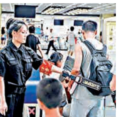
▲工作人員正在檢查乘客行囊

40%的客運任務，日均客流量超630萬。為減少對乘客的影響，今次常態化安檢主要通过手持探測儀檢查，而暫時不必排隊過X光機。而每條地鐵線還設一支10人的流動安檢督察隊跟車流動巡查。 廣州市社科院研究員談錦鈞表示，上下班時人流量巨大，若未實行有效的安檢措施，將存極大的安全隱患；而今次強化常態化的安檢十分必要，也是一個循序漸進的過程。廣州地鐵總公司也坦言，該措施是隨着安全工作要求和形勢變化、經過長期醞釀的一個決策。而本次廣州地鐵的常態化安檢招標文件，合同期限是兩年，並非意味兩年後不再執行加強安檢，將持續進行。