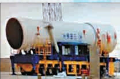
▲網傳長11火箭發射箭