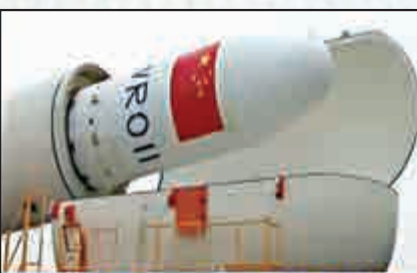
▲長11火箭真容 視頻截圖

長11火箭採用固體火箭發動機技術，為火箭實現快速發射提供了先天便利條件。其動力系統是固體火箭發動機，可以儲存，並且狀態穩定，為火箭整體貯存提供了可行條件。有發射需求時，將衛星與箭體進行匹配對接，即可非常快速地準備發射。而液體運載火箭在發射前才進行燃料和氧化劑的加注，需要耗費數小時才能完成，而且需要大量地面設備、資源進行配合與保障。 (中國航天報)