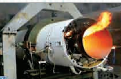
▲長11火箭發動機係自主研製 視頻截圖