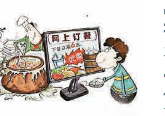
▲網售食品今後需持證上崗 網絡圖片

【大公報訊】新修訂的《中華人民共和國食品安全法》（下稱新「食安法」）將於10月1日起實行。新「食安法」被稱為「史上最嚴」的食品安全法，較現行「食安法」從104條增加到154條，對原有70%的條文進行了實質性修改，法律文本從1.5萬字增加到3萬字，法律責任從15條增加到28條。其中更引入「可追溯」和「實名制登記」兩項重要規定，使消費者可依法「連續追償」。 據第一財經日報報道，該法第62條規定，網絡食品交易第三方平台提供者應當對入網食品經營者進行實名登記，明確其食品安全管理責任；依法應當取得許可證的，還應當審查其許可證。 根據該規定，網絡食品交易第三方平台提供者發現入網食品經營者有違反本法規定行為的，應當及時制止並立即報告所在地縣級人民政府食品藥品監督管理部門；發現嚴重違法行為的，應當立即停止提供網絡交易平台服務。 另外，據第131條規定，網絡食品交易第三方平台提供者未對入網食品經營者進行實名登記、審查許可證，或者未履行報告、停止提供網絡交易平台服務等義務的，由縣級以上人民政府食品藥品監督管理部門責令改正，沒收違法所得，並處5萬元以上20萬元以下罰款。造成