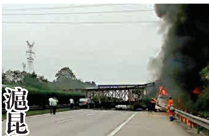
▲滬昆高速車禍，客車被撞起火

【大公報訊】據中新社報道：滬昆高速湖南境內潭邵段25日發生一起交通事故。截至目前，初步統計事故共造成22人喪生，13人受傷。事故原因正在調查中。 官方通報，當日上午9時50分許，一輛半掛車由東往西行駛至滬昆高速潭邵段1075公里時，車輛失控帶動一台同向行駛的輕型貨車一併衝到對向車道，與自西往東方向行駛由邵陽開往株洲的中型客車相撞，半掛車車頭與中型客車起火燃燒。同時，一輛小型客車行駛至事故路段，撞上半掛車。 初步核實，事故共造成22人喪生，13人受傷。目前，傷者已被送往醫院救治。據新華網報道，因事故現場死亡人員存在黏連，需要DNA鑒定等才能進一步核實出具體死亡人數。 記者抵達現場時，相關部門正在清理事故現場。高速公路中間的隔離帶已經被完全撞壞，燒焦的客車及掛車等正被拖離現場。高速交警在事故現場拉起了警戒線，並積極疏導雙向交通。據了解，事故車輛中的2名貨車司機人員已被警方控制，正分別接受調查。