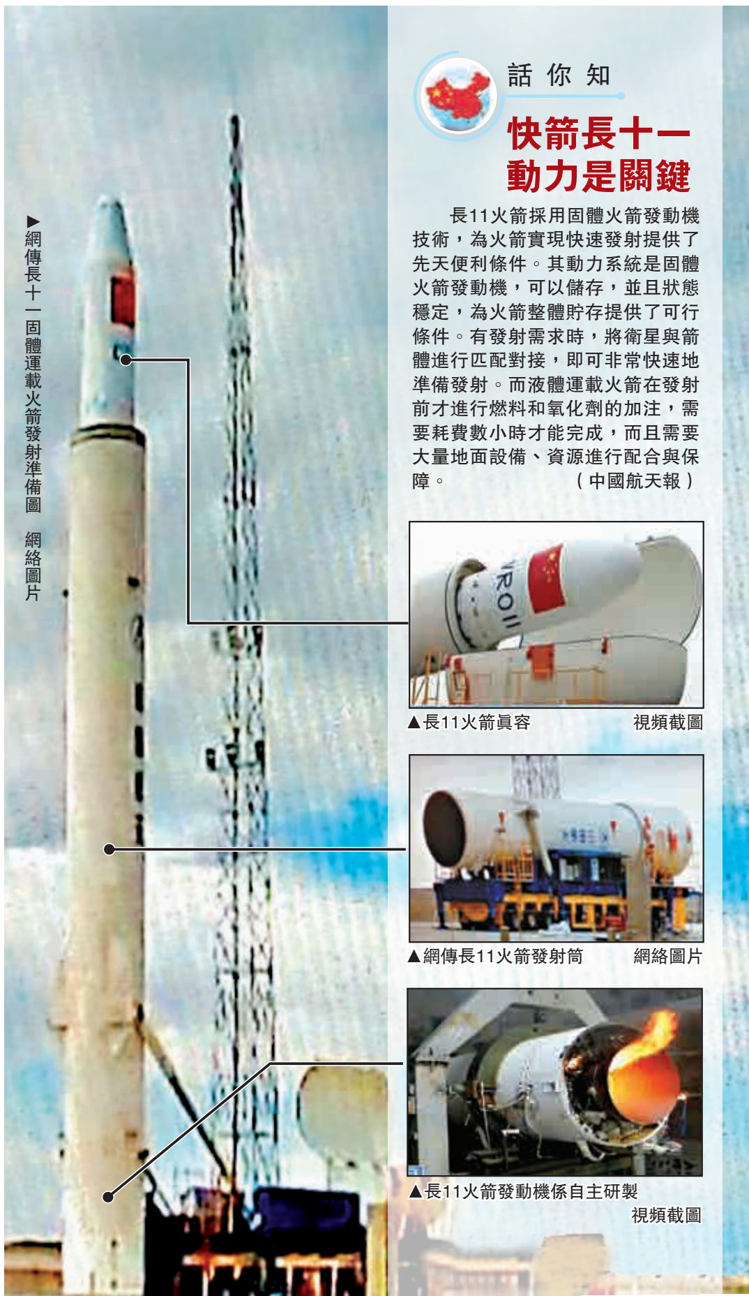
►網傳長11固體運載火箭發射準備圖

據介紹，火箭具有「強、大、快、簡」的技術優勢，運載能力和適應能力強，火箭規模和起飛推力大，測試發射快速，操作使用簡便，一體化、集成化、智能化程度高，綜合性能指標達到國際先進水平，可與國際主流固體運載火箭相媲美。首次在首飛固體運載火箭實現了一箭多星發射，標誌着我國具備了小衛星快速組網能力。