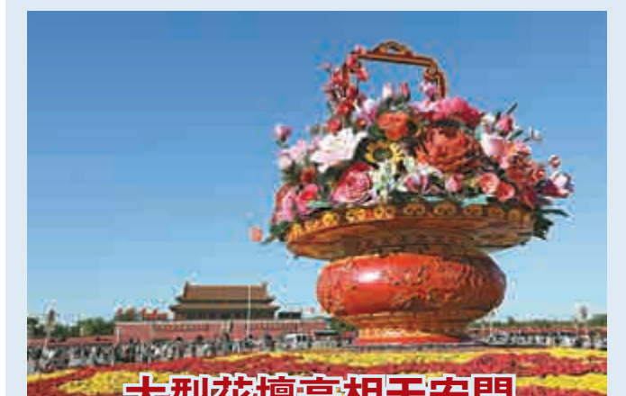
▲大型花壇亮相天安門

25日，「祝福祖國」大型花壇在天安門廣場完工。花壇共擺放8萬餘株鮮花，中心是直徑40米、高16米的巨型花籃，籃中是利用彩色打印和噴繪技術製作的20多種中外花卉；籃體表面嵌有牡丹浮雕、蝠紋紋飾、如意圖案等，寓意平安吉祥、和諧安康。