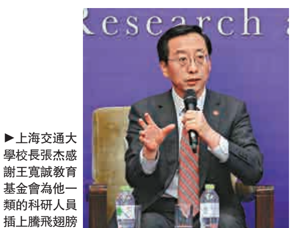
▶上海交通大學校長張杰感謝王寬誠教育基金會為他一類的科研人員插上騰飛翅膀

創立、打破考博士生須先通過政治審查的慣例，擇優取錄；基金會三十年發展，「以有限的資金辦更有效益的事情」的宗旨和實踐；資助項目的擴大，受助者的回憶和感念；以及王寬誠的人生觀、財富觀。