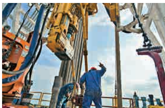
▲沙特由海外基金撤走700億美元資金，應付油價崩跌及赤字

過去多年來，沙特貨幣局透過多間大型投資機構管理其資產，包括Aberdeen資產管理、Fidelity、Invesco和高盛等。據行內人士稱，貝萊德是海灣國