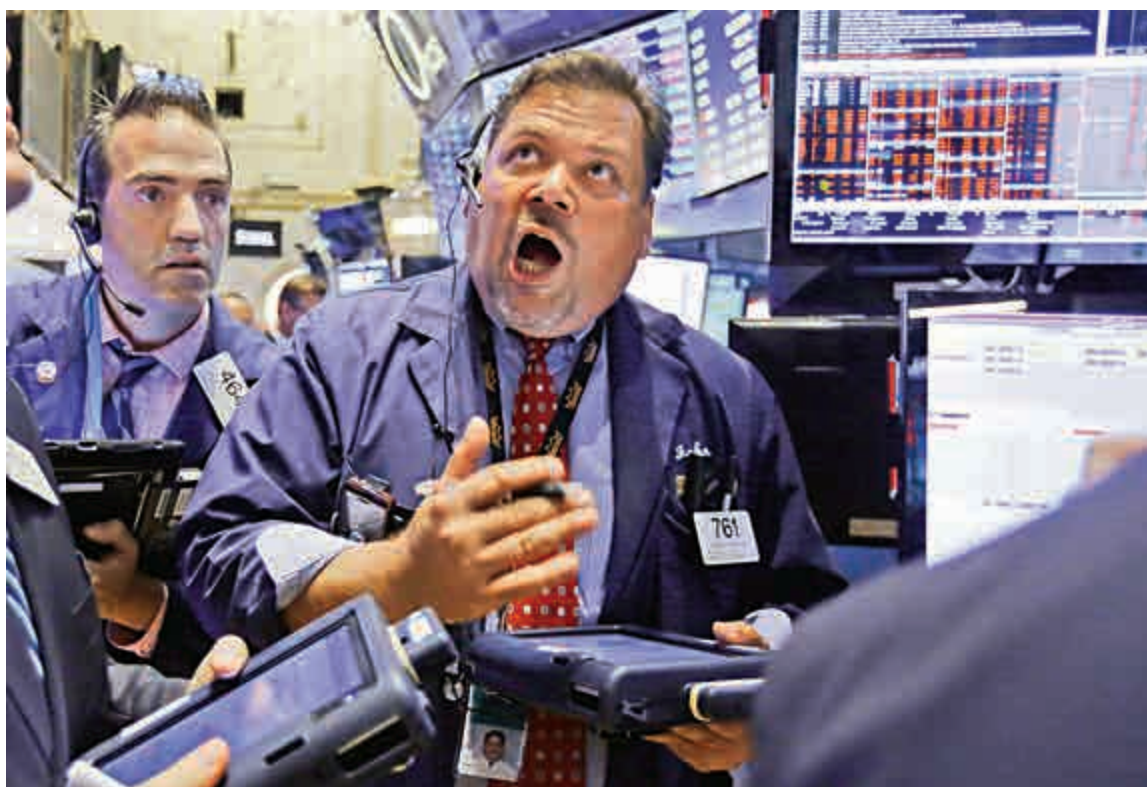
▲由於中國企業利潤增長表現不佳，歐美股市都出現下跌

至於股市在上周已跌入熊市的西班牙，股市在周一早段再跌0.4%，加泰羅尼亞的公投顯示，分離主義者未必能得到充分的授權推動獨立，總部設於加泰地區的CaixaBank和Banco de Sabadell的股價均升逾2.5%。