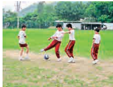
▲培養孩子遵守比賽規則，明白如何自制、自律和克己復禮 資料圖片