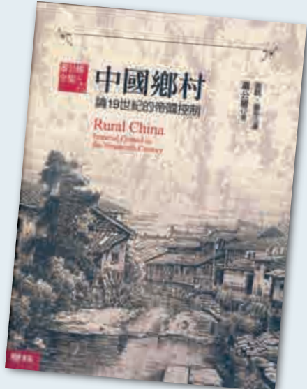
全面的認識。如果你像我一樣，等了本書譯本20多年，你拿着本書讀時，定會非常興奮。（內地由於版權問題，目前只出版了英文版） 香港通識教育會 李偉雄

為了讓臣民清楚了解《六諭》的內容，各州縣都要任命一名鄉約，定期講解「六諭」。每月初一和十五，鄉約要向鄉民講解《六諭》，並將鄉民的善行惡劣行為記錄下來。《六諭》的內容，包括：孝順父母、恭敬長上、和睦鄉里、教訓子孫、各安生理、無作非為。後來，康熙帝又頒布了《聖諭》，共十六條諭旨，取代《六諭》。講約原來的目的於教化「無知鄉人」，但是各個社會階層、各個民族也都有機會參加。1686年，清廷規定所有軍營都必須閱讀《聖諭》。1729年，當廣東船民被准許定居在岸上時，政府便在他們族眾中建立鄉約制度。 蕭教授又指出，政府要有效控制地方，除了思想控制之外，還須滿足人民的基本物質需求，並不斷監視臣民。讀畢全書後，我們會對清朝制度的運行有