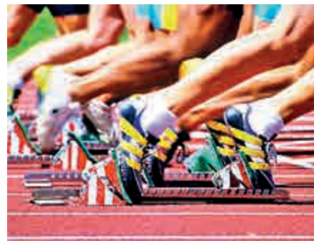
▲要城市人自動自覺的守法，必須靠教育，尤其是德育，另外還需要體育，體育可培養年輕人的守法精神

力的體育，為傳統的運動訂立比賽規則，減少殘暴，配合社會走向文明。蘇格蘭人發明的高爾夫球、英格蘭人發明的木球（又稱板球），運動員都沒有身體接觸，十分斯文。網球發源於12世紀的法國宮廷，不軍毫不暴力，而且極重禮儀。直至二次世界大戰，網球球衣只有純白，不容許花花綠綠的球衣，連帶觀眾也要衣着端莊。網球聖地溫布萊至今仍有「衣着守則」，男士必須穿外衣、結領帶。女士不得穿奇裝異服。女網球員一定要穿裙，不能穿褲。比賽時，要全場靜默，觀眾不得喧嘩，不准即時喝采，要打完一球後，才能拍掌歡呼或嘆息。 近代體育功能跟古代不同 為什麼要有這麼多煩瑣的規則？因為近代體育的功能，已跟古代不同。現代化和文明的公民，玩體育運動不單單為了強身健體、消遣時間，還要自制、自律、尊重對手（即是尊重自己）——用儒家的話說，就是克己復禮。此所以在任何比賽中，就算運動員認為球證判決錯誤或不公平，也必須絕對服從（當然，賽後可抗議、上訴）。不單運動員要克己復禮，觀眾也要克己復禮。英國在18-20世紀初成為超級大國，殖民地遍佈全球，體育運動盛行，是原因之一。 體育已成為另一種形式的德育，培養孩子遵守比賽規則，明白如何自制、自律和克己復禮。這統統是守法精神的基礎。 在現代社會，體育尚有其他功能和陰暗的一面，日後有機會在本欄詳述，但不能輕視其對西方文明化的貢獻！ 撰文：博文