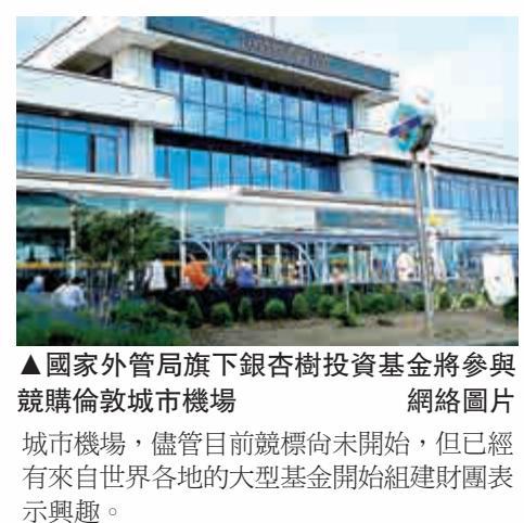
▲國家外管局旗下銀杏樹投資基金將參與競購倫敦城市機場

報道稱，在倫敦註冊的銀杏樹投資基金目前正在與澳洲金融集團麥格理就共同競購倫敦城市機場進行談判。其他參與競購的是由科威特主權基金和來自加拿大的一家教師養老基金以及赫爾墨斯投資公司組成的財團。按照計劃，正式發售公告將於本月底發出，預計第一輪競標將於11月底截止。該機場曾於2006年被全球基礎設施合夥人公司和橡樹資本以7.5億英鎊從愛爾蘭商人戴斯蒙手中購得。今年八月份，該機場兩大業主表示希望以20億英鎊的價格出售倫敦