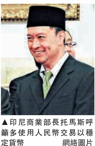
▲印尼商業部長托馬斯呼籲多使用人民幣交易以穩定貨幣

目前，印尼約20至30%的對外貿易使用人民幣交易。托馬斯認為，中國已準備好肩負更大的經濟責任，他又鼓勵東盟各國增加使用人民幣以穩定貨幣，並建議東盟各國央行持人民幣作為外匯儲備。