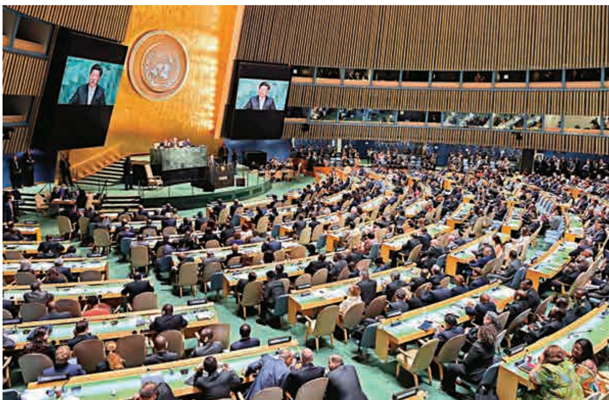
▲9月28日，中國國家主席習近平在聯合國大會上發言

此前，中國國家主席習近平上月底赴聯合國總部出席聯合國成立70周年峰會期間，共許下了約150億美元的承諾：包括1億美元用於對非盟無償軍事援助、10億美元的中國聯合國和平發展基金、20億美元南南合作援助基金，還有120億美元是在2030年前對最不發達國家的投資。