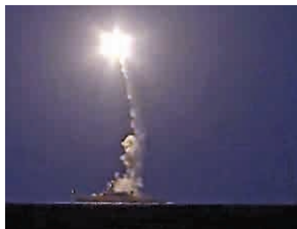
▲俄羅斯軍艦7日自裡海發射巡航導彈打擊敘利亞境內的ISIS目標

【大公報訊】綜合美國有線電視新聞網、路透社報導：美國有線電視新聞網（CNN）援引美國官員的說法稱，俄羅斯四枚從裡海發射的打擊敘利亞「伊斯蘭國