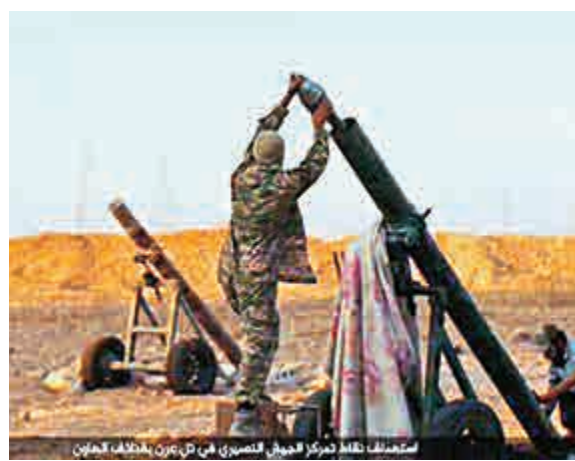
▲ISIS9日在互聯網上發布打擊敘利亞政府軍的視頻截圖