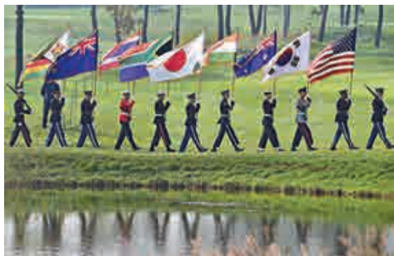
▲聯合國軍司令部10日在韓國首爾舉行舉旗紀念活動