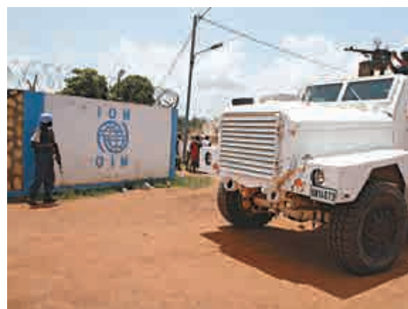
▲聯合國部隊3日在布隆迪執行任務

報告認為，「一帶一路」為人民幣國際化創造了難得的歷史機遇。大宗商品計價結算、基礎設施融資、產業園區建設、跨境電子商務等，應當成為借助「一帶一路」建設進一步提高人民幣國際化水平的有效突破口。