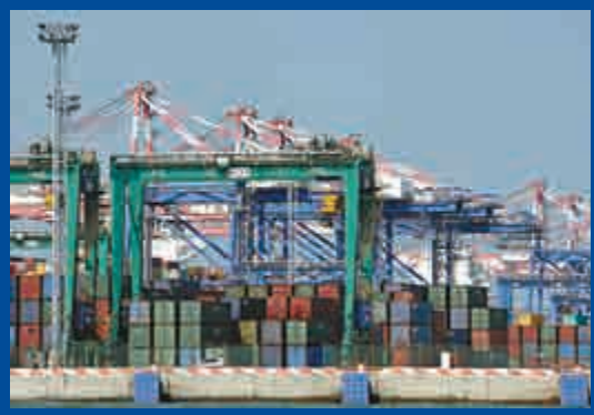
▲中國廈門國際貨運碼頭

卡內基國際和平基金會高級研究員黃育川亦表示，最終大家都會認識到TPP完全成功需要中國的加入，他同時強調，TPP的目標之一即是制定高標準的經貿規則，但如果主要經濟體不遵守這些規則，其意義就會明顯下降。