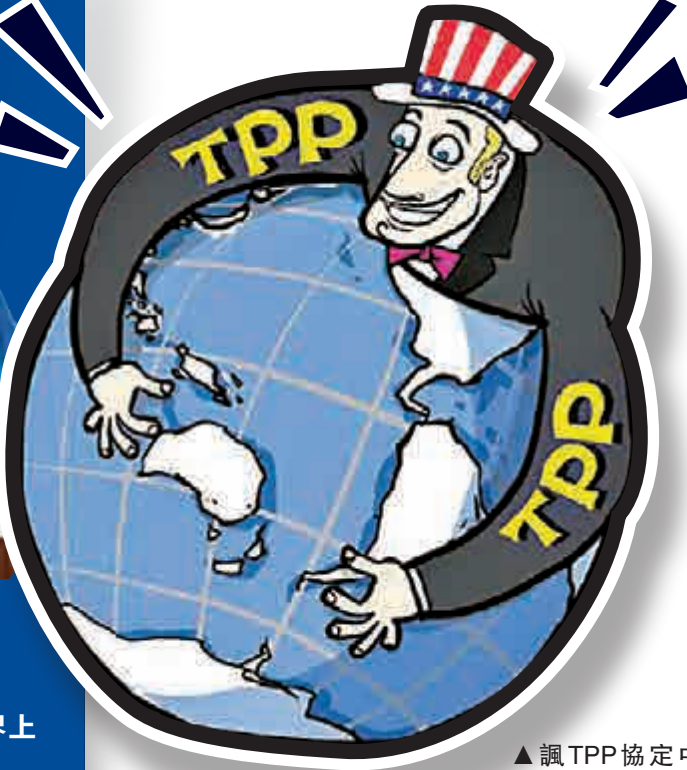
▲諷TPP協定中美國獨大的漫畫

倫敦政經學院國際事務研究員哈蒙德表示，TPP協議之所以引人關注，不僅在於12個簽署國的經濟總量，更在於這一協議在規則制訂方面的功能。基於此，奧巴馬已作出判斷，協定將讓華盛頓而不是北京來設定「21世紀的貿易規則」，也將幫助美國在戰略重地亞洲施加更多影響。