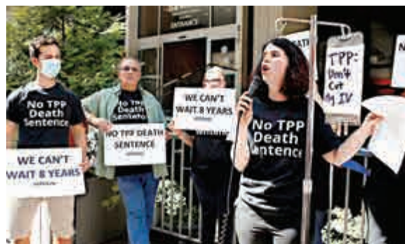
▲反對團體在亞特蘭大抗議TPP擬定之藥業條例

剛剛達成的「跨太平洋夥伴關係協定」(TPP)，被稱為過去20年以來所形成的最重要的國際性貿易協定。以美日為主導，該協定擁有着覆蓋全球經濟總量40%的巨大規模，並以期創建一項高標準、全覆蓋的地區合作模式。專家指出，儘管TPP的成形傳遞出了貿易轉型的先聲，但要獲得真正的經濟成效，或許仍需等待數年。 大公報記者 張藝融