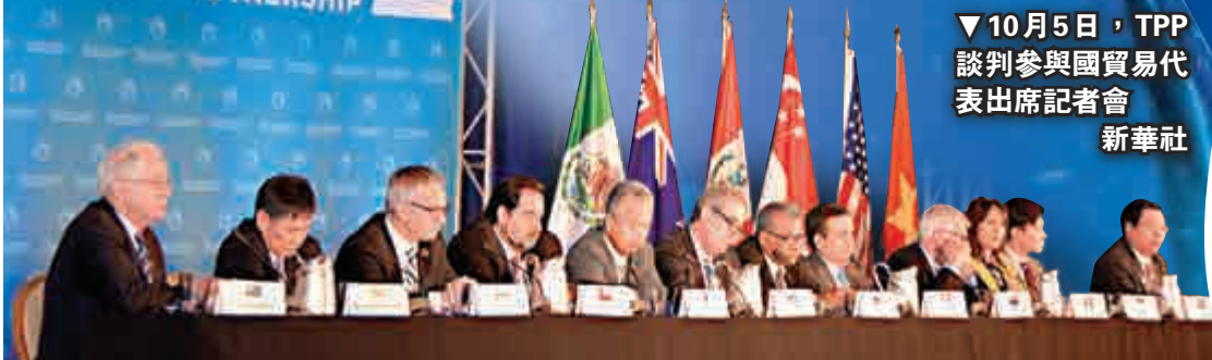
▼10月5日，TPP談判參與國貿易代表出席記者會 新華社

從中長期來看，它符合貿易自由化的進程，並將深入更為廣泛的經濟領域，但利波爾強調，這個過程的確仍需數年甚至更長時間。