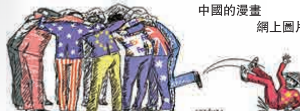
▲諷TPP合作排斥中國的漫畫 網上圖片

此外，TPP協定中未包含全球第二大經濟體中國，亦引發爭論。評論指出，北京提出的「一帶一路」與亞洲基礎設施投資銀行等，意將主導全球的經貿發展政策。中方雖不是TPP成員國，但對馬來西亞、越南、新加坡和文萊等東盟成員有着高度影響力，這些國家如何平衡美中兩強的策略競爭，也是重要議題。