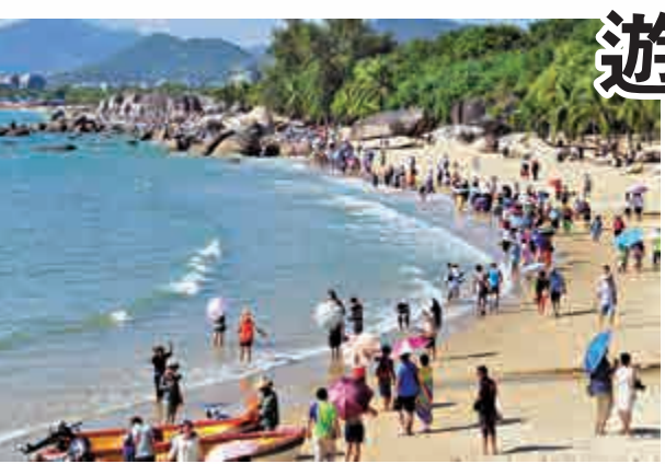
▲海南三亞一直是遊客喜愛的海島

1954年，十世班禪出席第一屆全國人民代表大會，在會議期間，他與十四世達賴聯袂前往西黃寺朝拜清淨化城塔。1987年9月1日，法號聲聲，佛樂齊奏，十世班禪親手創建的中國藏語系高級佛學院在西黃寺正式成立，他親任第一任院長。