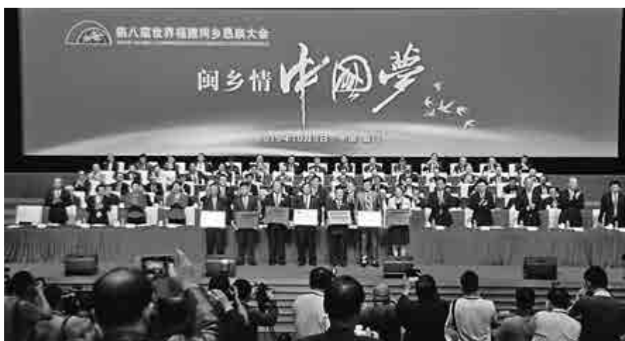
▲在本屆懇親大會上，香港福建社團聯會等15家閩籍海外社團被授予「僑社禮讚」稱號

時隔十年，世界福建同鄉懇親大會再次回到福建召開，共有來自70個國家和地區的305個社團的1669名海外嘉賓參加。郭鶴年、胡仙、陳守仁、李深靜、俞雨齡、洪祖抗、許榮茂、陳明金等福建海外鄉親代表出席大會活動。福建省委副書記于偉國在接見海內外福建鄉親代表時表示，中央先後出台一系列政策，支持建設21世紀海上絲綢之路核心区、平潭綜合實驗區、生態文明先行示範區、中國（福建）自由貿易試驗區，最近又批覆設立福州新區。「福建當前擁有「五區」疊加優勢，是前所未有的重大歷史機遇，歡迎海外福建鄉親回鄉投資，共同為實現中華民族偉大復興的中國夢貢獻力量。」