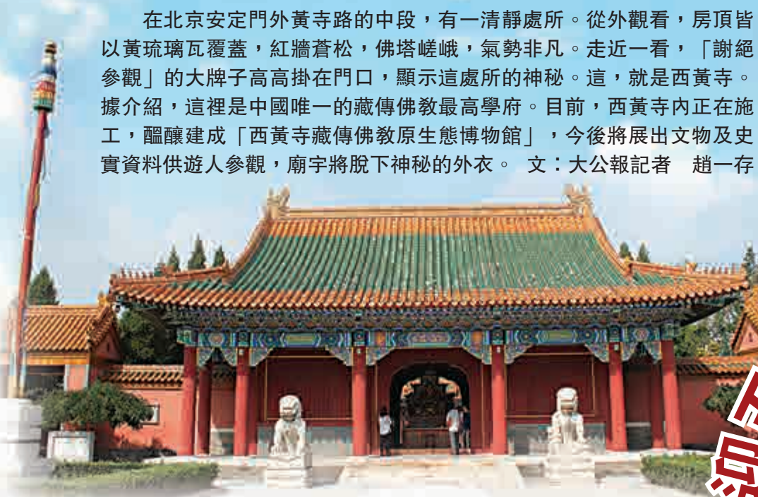
▲雄偉莊嚴的西黃寺

在慧香閣後面，有一座黃、紅兩色的藏式小樓，三五成群、身著藏紅僧袍、手持念珠的僧人不時走過，這就是中國藏語系高級佛學院，即目前中國唯一藏傳佛教最高學府的教學樓——陽光樓。樓內近十間教室裡的木方桌、錦坐墊，牆上懸掛的唐卡、哈達，處處都是藏式