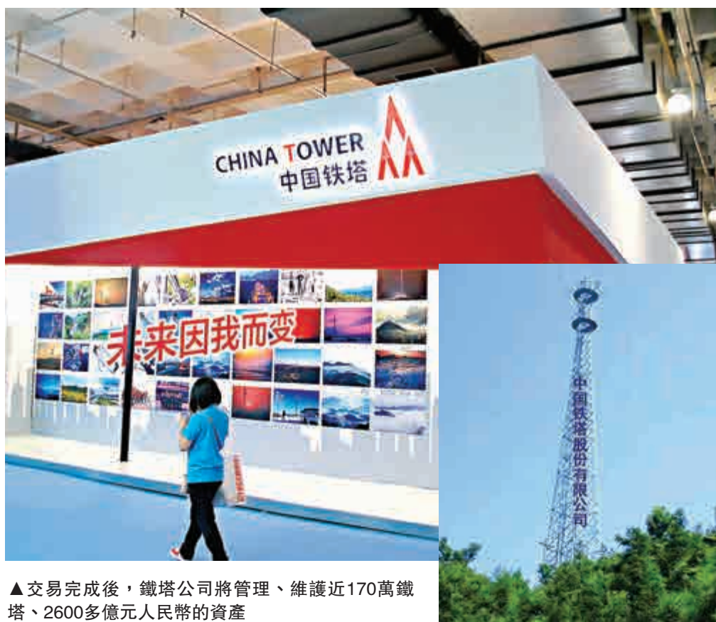
▲交易完成後，鐵塔公司將管理、維護近170萬鐵塔、2600多億元人民幣的資產

根據中移動公布，其向鐵塔轉讓的資產估值及帳面值分別約1163.7億元（約1426.3億港元）及969.2億元（1187.9億港元），而鐵塔則會向中移動發行每股一元，約511.1億股，餘額則會於2017年底以前支付，其中首期支付約50億元（約61億港元）。