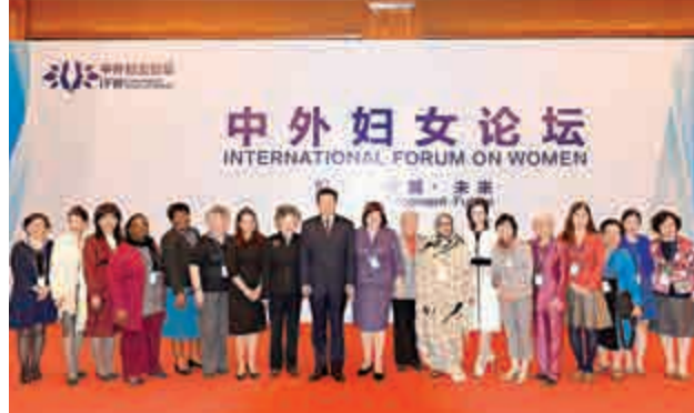
▲14日，中外婦女論壇大會在北京開幕。圖為與會嘉賓合影