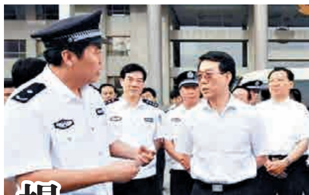
▲楊煥寧(右二)

【大公報訊】公安部常務副部長、黨委副書記楊煥寧調任國家安監總局局長，14日上午已到任，將全面負責安監總局工作。國家安監總局相關負責人稱，14日上午中組部有關人員到安監總局召開會議並公布了這一消息。截至發稿，國家安監總局官網尚未更新相關信息。