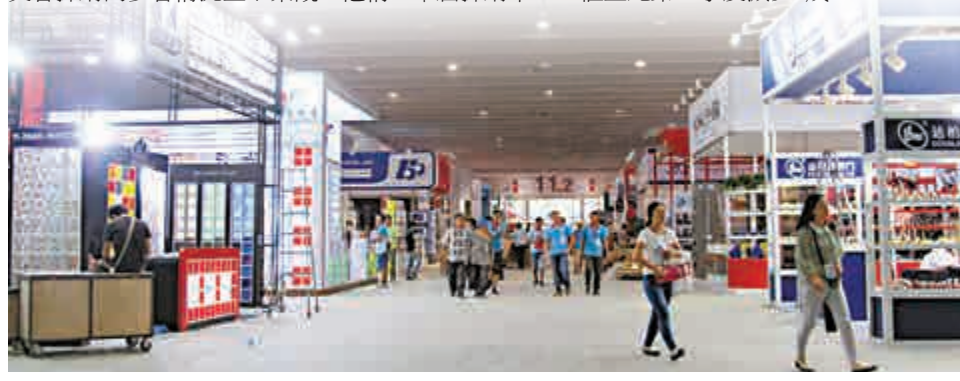
▲第118屆廣交會15日開幕，不少企業正在布展

專營玻璃磚的河北吉恆源實業集團外貿經理孔柳柳稱，公司9成業務出口亞非拉等發展中國家，然而受經濟不景氣以及貿易壁壘拖累，第三季度貨櫃量比第二季度減少6成。