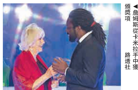
►詹姆斯從卡米拉手中獲頒獎項