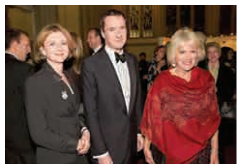
▲卡米拉與英國財相歐思邦和妻子弗朗西斯13日出席頒獎禮，弗朗西斯（左）也是本次布克獎評委