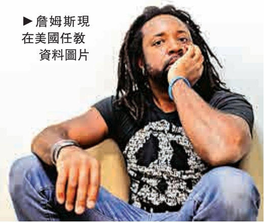
►詹姆斯現在美國任教