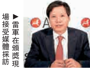
►雷軍在頒獎禮現場接受媒體採訪

也有能力製造出高質量的產品。「利用互聯網的方式，我們可以做非常便宜、同時價錢也非常便宜的產品，讓全世界每一個人都可以享受到科技的樂趣。」 另一位華裔獲獎者李存信，是著名的舞蹈藝術家，如今定居在澳洲。他表示，亞洲協會能夠專門表彰不同地區和不同領域的亞裔人士，是一件非常有意義的事；而自己的一生「能夠通過文藝給社會做出一些貢獻，通過芭蕾舞來打破不同文化之間的界限，我還是挺滿意的。」