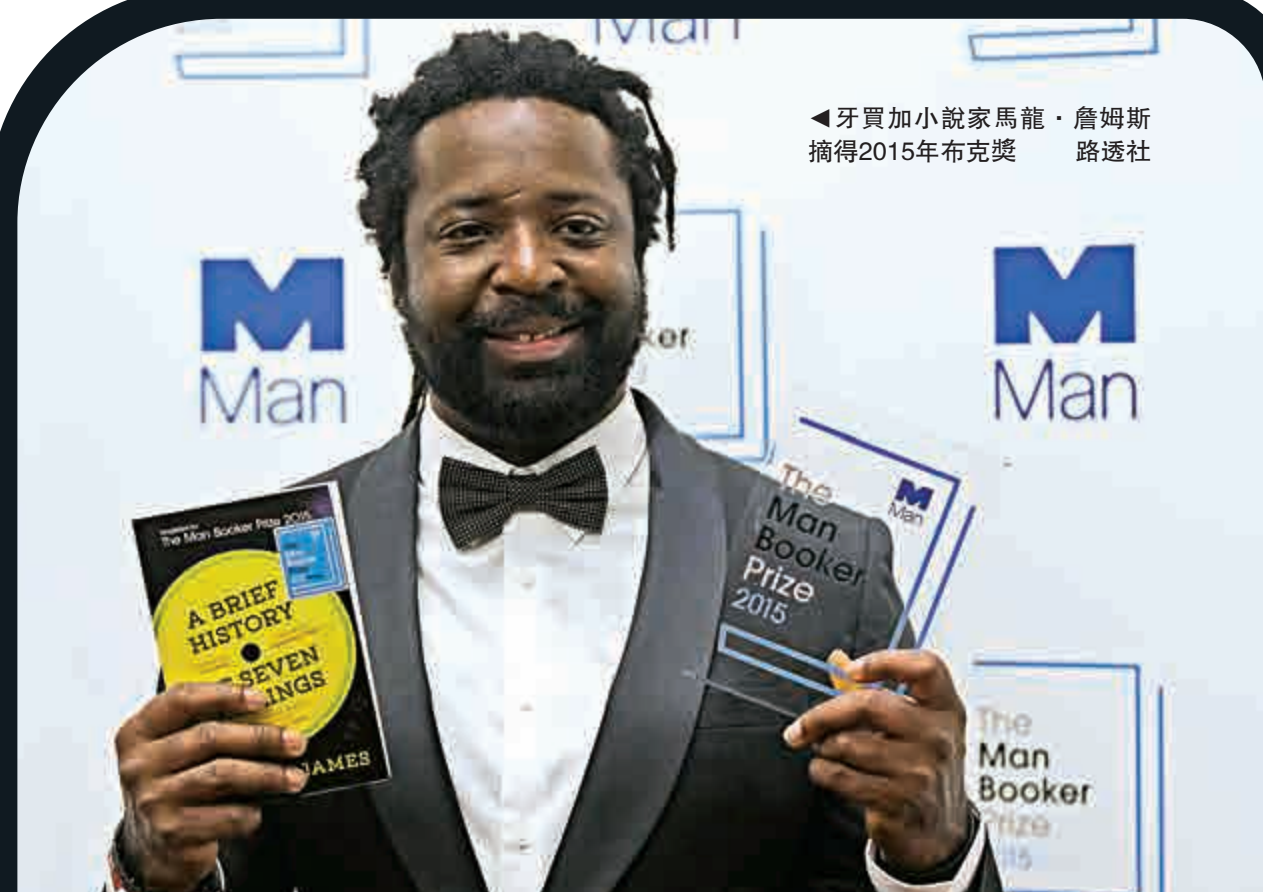
◀牙買加小說家馬龍·詹姆斯 摘得2015年布克獎