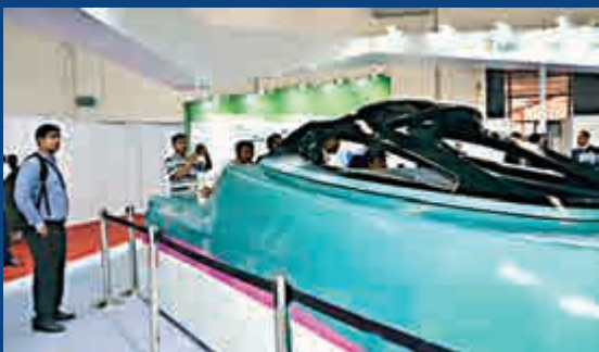
▲日本在印度新德里高鐵技術展上展示的新幹線列車模型