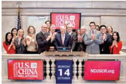
▲美中關係全國委員會14日在紐約證券交易所舉行開市敲鐘儀式

美國前國務卿基辛格、中國駐美大使崔天凱與數百名積極推進中美兩國關係的各界友好人士出席了當天的晚宴。