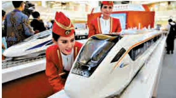
▲今年8月，中國公司在在印尼雅加達一個商場展出的中國高鐵列車模型

在此前印尼高鐵計劃的爭奪戰中，最終日本不敵中國落標，馬來西亞和越南有可能成為中日下一個高鐵戰場。吉隆坡和新加坡之間的馬新高鐵項目明年將招標，越南2010年提出發展高鐵但因經費龐大而擱置，近期越南又透露建設高鐵意向，勢將再引發中日競逐。