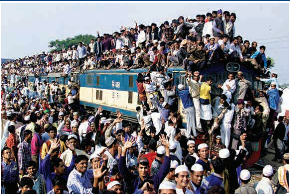
▲印度鐵路系統落後且擁擠不堪