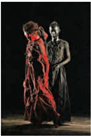
楊麗萍新作亮相滬藝術節

劇中唯一的女性角色虞姬，也如傳統京劇中的旦角一樣，由男舞者反串。在十面埋伏的氛圍裡，在你爭我鬥的殘酷環境中，虞姬雖然於功業成敗之外，卻依然傾軋於戰亂紛爭之中。通過《十面埋伏》舞蹈劇場的形式，楊麗萍從她冷靜的角度，展現了人性深處的欲望和恐懼，同時也將亘古不變的追問呈現於舞台。