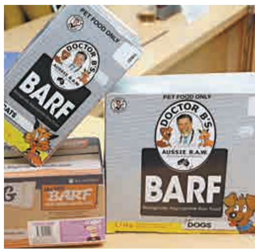
▲消委會檢測發現，三款凍生肉糧樣本均檢出沙門氏菌