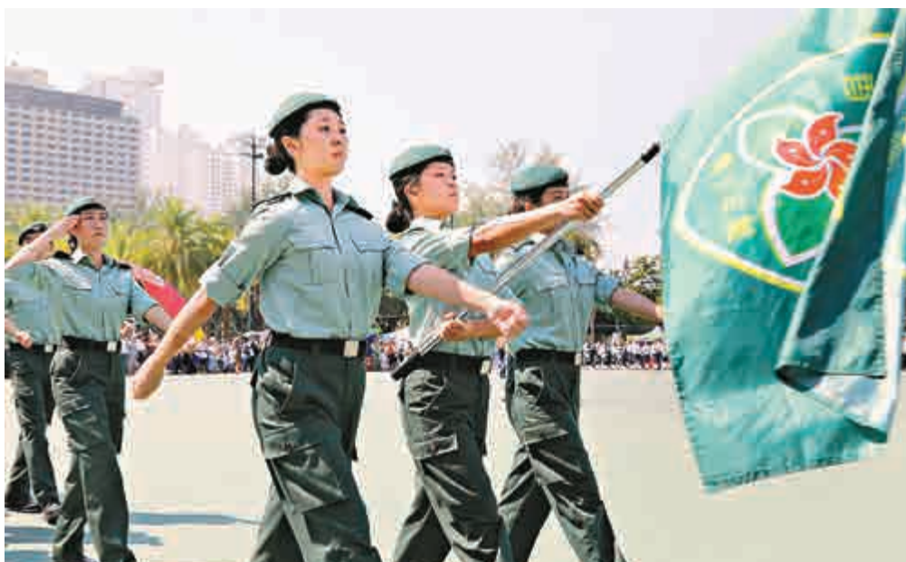
▲今年初成立的「香港青少年軍總會」昨日首次參與制服團體會操

「制服團體日暨青少年發展日2015」的合辦團體包括：香港女童軍總會、香港女童軍總會、香港航空青年團、香港海事青年團、香港少年領袖團、香港紅十字會、香港聖約翰救傷隊少青團、香港基督少年軍、香港基督女少年軍、香港交通安全會、香港升旗隊總會、民安隊少年團、醫療輔助隊少年團、香港青少年軍總會、香港青年獎勵計劃、義務工作發展局和少年警訊。