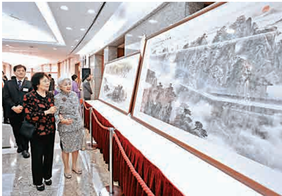
▲香港基本法委員會副主任梁愛詩（右）參觀書畫展