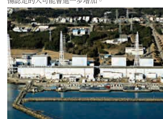
▲福島第一核電站發生泄洩事故至今已超過4年半

44851名工作人員參與了福島第一核電站搶險，人均遭受的輻射量平均約為12毫希沃特，其中約有佔47%的人超過了每年5毫希沃特的標準。由於報廢反應堆的工作遠遠看不到結束的眉目，因此今後因遭受輻射而申請工傷認定的人可能會進一步增加。