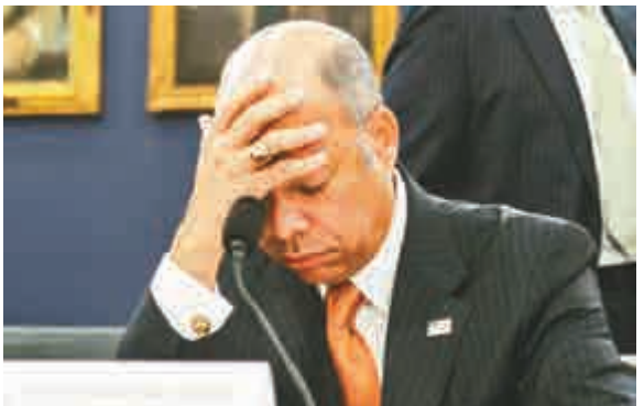
▲美國國土安全部長約翰遜

有從事執法工作的消息人士說，聯邦調查局及其他聯邦機構正調查上述的該名黑客。有消息人士指當局有可能會對這幾名年輕的黑客提出刑事訴訟，以達到殺一儆百的效果，但他同時表示目前的情況很「瘋狂」，「不敢相信他們會對中情局局長做這種事。這些老一輩的人的問題在於，你也看到他們對網絡保安一無所知，這或許將會是一個很大的問題」。