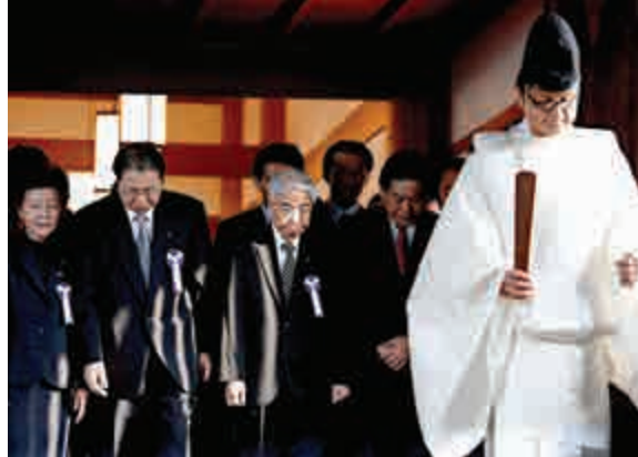
▲20日，日本多位政府官員到靖國神社參拜

奧巴馬還說：「我們必須觀察、栽培與鼓勵那一點點的好奇心與可能性，而不是去抑制與壓抑。」