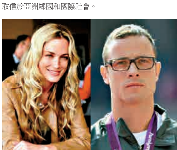
▲刀鋒戰士（右）及被其殺害的女友

中國外交部發言人華春瑩19日表示，中方一貫堅決反對日本政要參拜靖國神社，敦促日方切實正視和深刻反省侵略歷史，同軍國主義劃清界限，以實際行動取信於亞洲鄰國和國際社會。