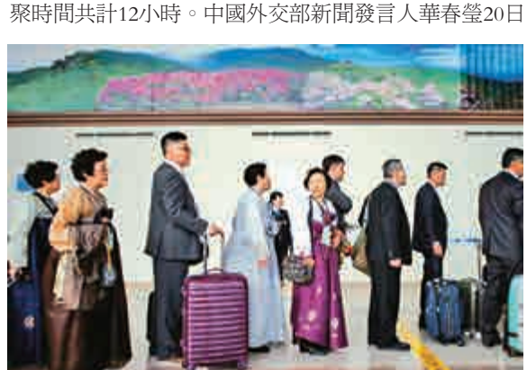
▲準備參加「第20次離散家屬團聚」的韓國人士

【大公報訊】據英國廣播公司、韓聯社報道：「第20次離散家屬團聚」活動於20日在朝鮮金剛山開幕。團聚將按照集體團聚、歡迎晚宴、單獨團聚、共同午餐、集體道別與單獨道別的順序進行，每項活動2小時，團聚時間共計12小時。中國外交部新聞發言人華春瑩20日