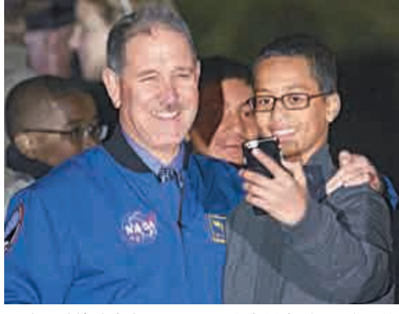
▲穆罕默德（右）和NASA工作人員合影