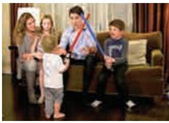
◀特魯多與妻子育有三名子女 路透社