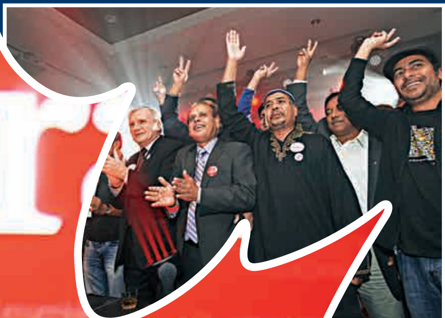
◀加拿大自由黨黨魁特魯多19日發表勝選講話