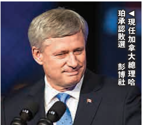
▶現任加拿大總理哈珀承認敗選 彭博社

自由黨議員麥家廉7月份訪問中國時，曾闡述該黨對未來中加關係的立場。他表示，如果自由黨當選，將推動加國加入亞投行，並開啓與中國的自由貿易談判。他還稱，自由黨將小心檢討現行技術移民「特快入境」制度中的對語言的要求規定，確保來自中國的技術移民申請人，不會因為語言水平問題而受歧視對待。 中國外交部發言人華春瑩20日對特魯多當選表示祝賀，表示中方重視發展中加關係，願同加新一屆政府共同努力，進一步拓展兩國各領域對話、交流、合作，推動中加關係取得更大發展。