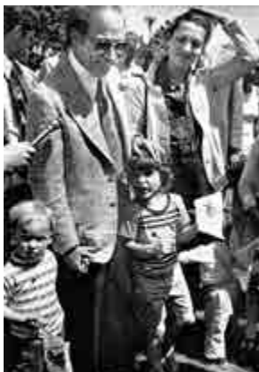
▲1977年5月，時任加拿大總理皮埃爾·特魯多（左二）一家在渥太華出席活動，左三為長子賈斯廷·特魯多