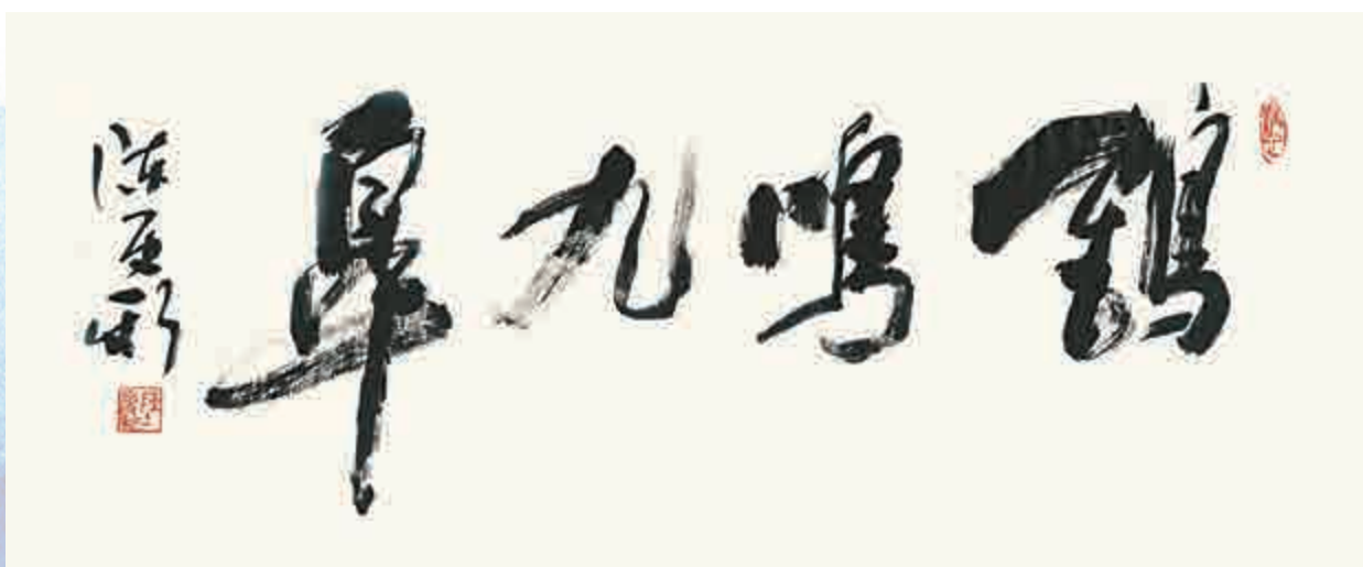
▲行書 詩經句《鶴鳴九皋》