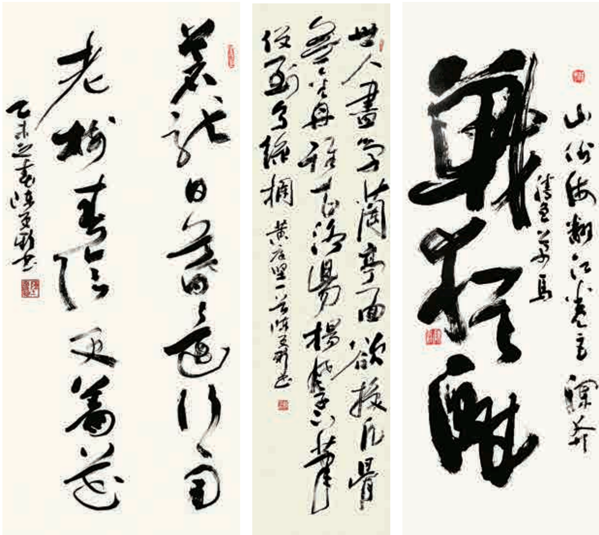
▲行草聯句《蒼龍、老樹》 ▲行草 黃庭堅詩《跋楊凝式帖後》 ▲行草 毛澤東十六字令《戰猶酣》