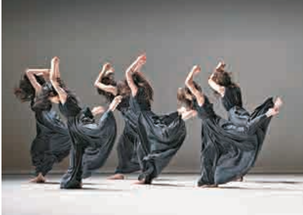
▲現代舞團「雲門2」演出劇照