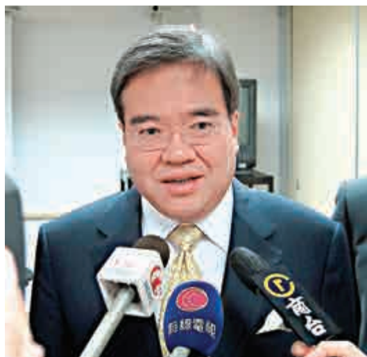
▲胡定旭表示，公院醫生工作量大，工資亦較私人市場低很多，醫生期望加薪的要求合理

【大公報訊】綜合報道：醫管局前主席胡定旭坦言，雖然過往醫管局及政府未明言醫生與公務員薪酬掛鉤，但一直以來都有「默契」。而公立醫院醫生工作量大，收入又較私人市場低很多，加薪的要求屬合情合理，醫管局財政亦應應付今次3%的額外加薪。他建議醫管局向醫生調查是否希望長遠跟隨公務員薪酬，並爭取更靈活調配內部資源。