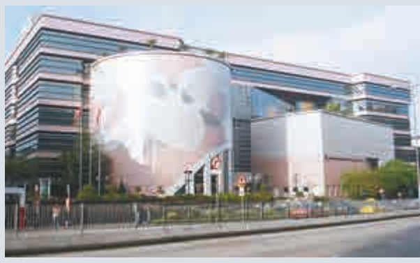
▲醫院管理局於1990年12月正式成立 資料圖片

高永文昨日出席醫生靜坐活動時稱，醫管局成立初期，轉制醫生已獲得加薪，政府視作醫護人員薪酬當時已和公務員脫鉤。惟醫管局只需符合有效利用公務的原則，即可自行分配政府每年給予的一筆過撥款決定員工薪酬待遇，並且強調政府原則上支持醫管局動用本身資源，讓公立醫院醫生跟隨高級公務員加薪3%，相信問題能在短期內解決。