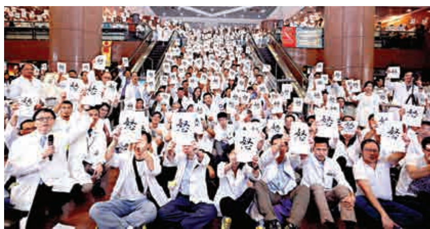
▲約1300名醫生昨靜坐要求加薪