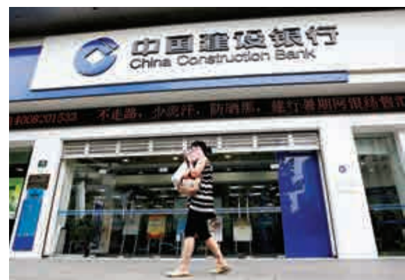
▲券商料內地續採措施刺激經濟，對銀行股有利

【大公報訊】市場憂慮人民幣再有貶值壓力，拖累內地A股倒跌。港股ADR早段亦挫逾250點，報22737點。港股於重陽節假期休市一天，分析員普遍預期，即使港股跟隨內地股市低開，惟大幅調整的壓力暫有限，畢竟投資者仍然抱觀望心態。