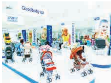
▲好孩子近期再推出兩款新品

逾6500專利，每年推出500多項新品，去年還完成美國百年品牌Evenflo、歐洲高端品牌Cybex的國際化併購。