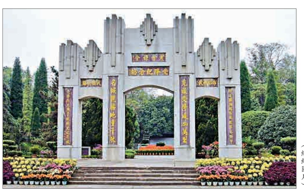
「受降紀念坊」是抗日戰爭勝利的歷史見證（網絡圖片）

聳立在湘西芷江的「受降紀念坊」，是中華民族抗日戰爭勝利的歷史見證，又稱中國的凱旋門，是當今世界上六座凱旋門之一。 「受降紀念坊」因何建在芷江呢？ 如平型關、台兒莊等處一樣，芷江既是中國軍隊痛殲日軍的福地，又是令日本侵略者傷心的地方。抗戰期間的芷江，是重要的空軍基地，中國與盟軍戰機屢屢從這裏起飛，轟炸敵人的陸地水上目標，給予沉重打擊。一九四五年四月九日，日軍發起「芷江攻路戰」，兵分三路合圍芷江。中國軍隊本誓死保衛芷江之旨，頑強據守近二個月，取得最終勝利，斃敵一萬二千五百人，傷敵二萬二千三百餘人，中外輿論譽之爲「中國的新斯大林格勒保衛戰」，芷江因此名揚四海。 同年八月十五日，日本自認戰敗，宣布無條件投降。遵照中國戰區最高統帥蔣介石的命令，侵華日軍總司令岡村寧次指派代表，前往芷江洽談侵華日軍投降事宜。 八月二十一日，日軍總參謀副長今井武夫帶着參謀、翻譯，按中方規定的時間、機型、航線、高度、標識，在我國戰鬥機護送下飛抵芷江。 洽談投降會場設在芷江城東七里河橋磨溪口，今井武夫向中國陸軍副總參謀長蕭毅肅呈上侵華日軍駐紮圖，接受了有關投降各事的備忘錄。 二十三日午，中國陸軍總司令何應欽召見今井武夫，責令其轉告侵華日軍總司令岡村寧次，必須切實執行備忘錄規定的所有事項，不得有違。今井武夫唯唯稱是，鞠躬退出。 「八年烽火起瀟湘，一紙降書出芷江」。一九