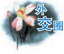
潘基文擔任聯合國秘書長後，深知重任在肩，工作勤奮，一絲不苟。秘書長面對大量國際事務，情況紛繁複雜，處理判斷不容絲毫有誤。據傳向他彙報工作，稍有失誤，都能被他察覺。他通曉英語、法語、會日語、懂漢字，一年到頭，除聯合國本部大量事務外，又不辭勞苦，奔波於世界各地，處理與聯合國有關的問題。

不久前，習近平主席出席聯合國成立七十周年系列峰會期間，我們幾乎每天通過電視看到，聯合國秘書長潘基文陪同他一起活動的身影。習近平在聯合國大會，潘基文坐在主席台上；習近平向聯合國贈送《和平尊》，潘基文與習近平一起揭開開幕；聯合國舉行婦女峰會，潘基文又坐在習近平身邊。潘基文還有幾次開會時與彭麗媛鄰坐。這不是巧合，表明他與中國的關係非同一般。 潘基文此人，我在韓國國內不止見過一次。一九九二年出任總統安大保首席助理，我們曾多次見面。後來二〇〇五年，潘基文作為韓國外交部長官來中國訪問，時隔多年我又有機會見到他。每次見面，他都熱情誠懇，和藹可親，握手寒暄，就像老朋友一樣。 潘基文出身於韓國職業外交官，忠清道人士，現年七十一歲。有傳聞潘基文起源於中國，後部分遷往朝鮮半島，不知可信度如何。潘基文畢業於首爾國立大學外交系，經考試及格進入外交部，從科員做起，踏實勤奮，刻苦努力，步步高升，直到出任駐聯合國大使，回國後又出任外交部長官。二〇〇六年，潘基文競選聯合國秘書長，在幾個候選人中，他得到中國等安理會常任理事國和成員國的支持，順利當選，二〇一一年他再次當選連任。 潘基文擔任聯合國秘書長後，深知重任在肩，工作勤奮，一絲不苟。秘書長面對大量國際事務，情況紛繁複雜，處理判斷不容絲毫有誤。據傳向他彙報工作，稍有失誤，都能被他察覺。他通曉英語、法語、會日語、懂漢字，一年到頭，除聯合國本部大量事務外，又不辭勞苦，奔波於世界各地，處理與聯合國有關的問題。 作為聯合國秘書長，潘基文曾多次訪華，受到習近平主席、李克強總理的會見。今年，他參加波蘭、俄羅斯紀念二戰勝利的活動，這次又不遠萬里，前來北京出席抗日戰爭勝利七十周年紀念活動，顯示了他在複雜情況下頭腦清晰、明查事理的水準。日本出於不可告人的目的，多次指責他作為聯合國秘書長應遵守「中立」，不應該參加中國的紀念活動。他反駁說，聯合國秘書長應遵守的不是「中立」，而是「公正」。他不止一次讚揚中國對二戰作出的貢獻和犧牲，強調只有回顧歷史，才能走向光明的未來。 這次在聯合國成立七十周年系列峰會上，潘基文陪同習近平主席出席多項活動，既盡到秘書長的職責，也表達了他對中國的深厚情誼和無限期待。