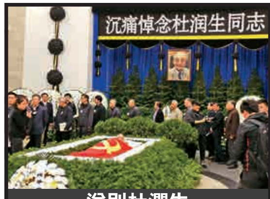
沉痛悼念杜潤生同志 送別杜潤生 23日，杜潤生追悼會在北京八寶山殯儀館大禮堂舉行。大禮堂擺放了習近平、李克強、張德江、俞正聲、劉雲山、王岐山、張高麗等黨和國家領導人敬送的花圈，江澤民、胡錦濤等敬送的花圈也依次擺在現場。中央和國家機關有關部門負責人，杜老生前好友和家鄉代表前來送別。

對接港澳是江門未來發展另一重點。港珠澳大橋通車後，江門將實現與香港、澳門、廣州、深圳、珠海等重要城市1.5小時生活圈，江門未來五年投入超千億元，構建「三大路網、一大樞紐」，進一步突顯「左聯廣佛、右連珠中、拉近深莞、直通港澳」的綜合性樞紐地位，使人流、物流、信息流在這裏融會貫通。