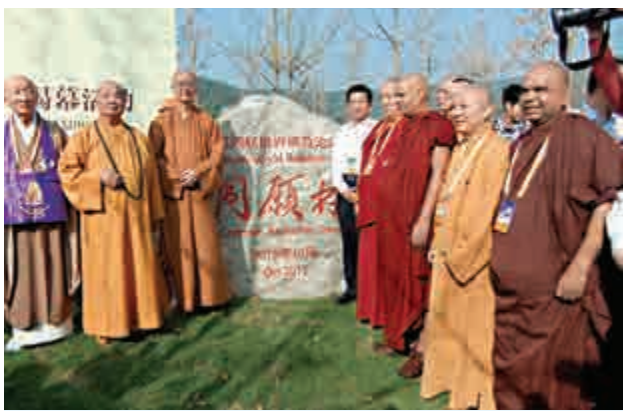
▲23日，海內外高僧大德們在無錫與「同願林」紀念碑留影

本屆論壇還設有8個分論壇和3個電視論壇，並首次設立3個新媒體論壇。8個主題分論壇的內容豐富性和現實針對性，在前三屆論壇基礎上有了較大拓展創新，充分回應了國際社會對佛教更深入參與人類文明新進程的期待與呼喚。3個新媒體分論壇更是緊扣時代與社會熱點，讓佛教高僧大德與新媒體前沿的精英和各領域專家跨界爭鳴，撞擊出智慧的火花，將借助三維動畫影視、線上圖文視頻轉播等多種新媒體方式，在網站、微博、微信和手機客戶端中全方位呈現。