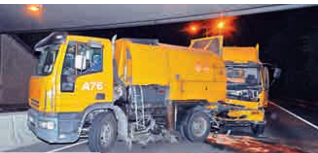
▲元朗公路兩車相撞意外現場 ▲車禍中受傷的洗街車司機

【大公報訊】元朗公路昨凌晨發生罕見奪命車禍，一輛擔當護航任務的「箭咀車」，尾隨一輛洗街車行駛期間，突然失控撞向前車車尾部分，並推向前車約十米後始停下，「箭咀車」車頭損毀嚴重，男司機當場浴血昏迷被困，消防員救出送院證實不治，被撞屬同一工程公司的洗街車司機輕傷無大礙，他事後嘆嘆：「唔知佢點解撞嚟……」警方已對車禍展開調查。