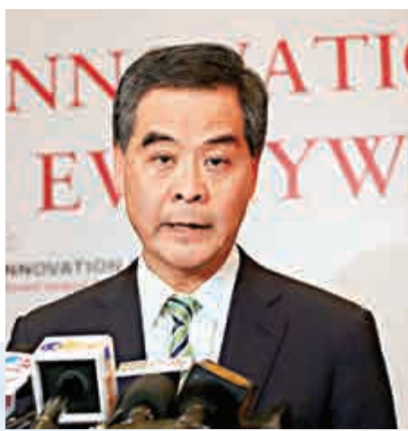
▲梁振英指，政府高度重視汲水門橋事件，強調封橋是以安全為重