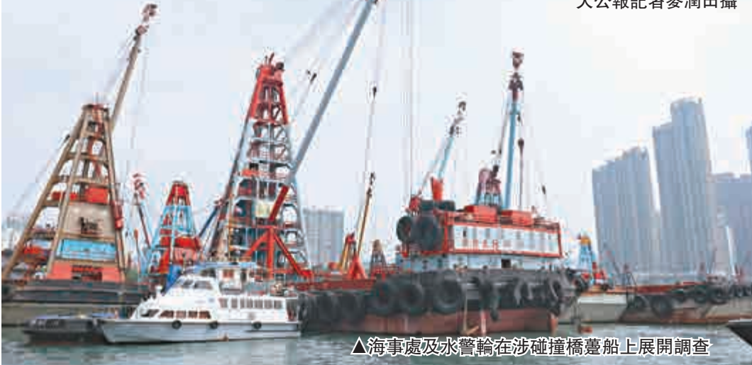
▲海事處及水警輪在涉碰撞躉船上展開調查