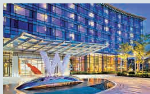
▲喜達屋酒店集團是全球最大酒店集團之一，旗下包括喜來登及W Hotel等九個品牌

有消息指出，超過12家公司已經查詢與喜達屋合併的相關事宜，但仍不確定有多少公司發出正式