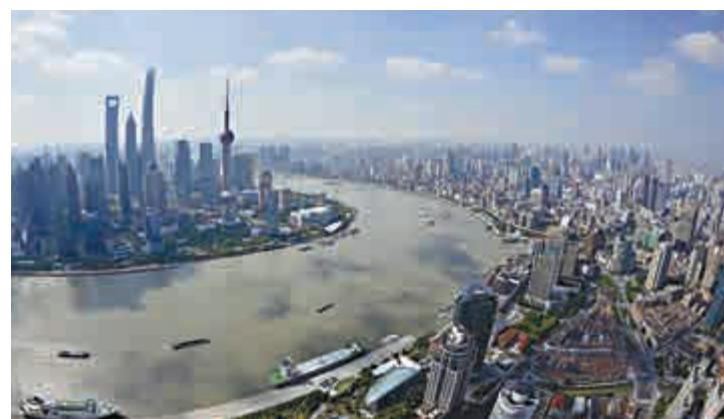
▲中國內地在十大便利營商環境指標中，以「執行合同」排名最前，位列全球第七位

儘管東亞及太平洋地區的營商環境不斷改善，但項目主管指出，該區在「辦理破產」、「執行合同」和「登記財產」等領域，仍存在不少挑戰。以「登記財產」而言，該區創業者完成一項財產轉移平均需要74天，而全球平均只要48天。