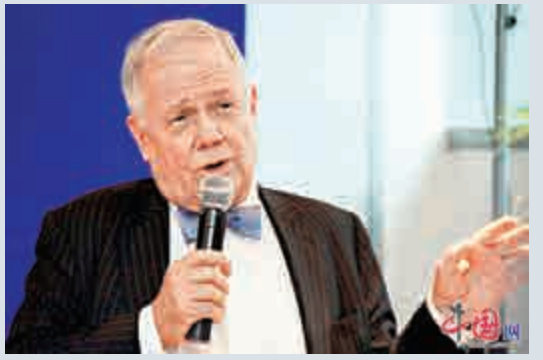
▲羅傑斯表示，繼續看好中國經濟，但是科技股板塊估價較高

【大公報訊】A股近期政策面利好不斷，惟中小股行情不升反跌。資本大鱗羅傑斯就提醒投資者稱，中國股市中的科技板塊估價較高，存在潛在泡沫風險。上投摩根基金經理盧揚亦認為，經歷本輪反彈之後，部分成長股甚至回到前期高點，存在較大獲利回吐壓力。從後市來看，低估值藍籌的投資機會更好。