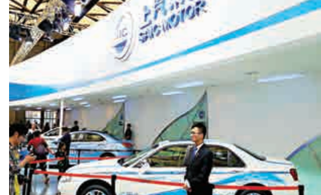
▲上汽集團是A股最大的汽車上市公司，亦是內地新能源汽車先行者