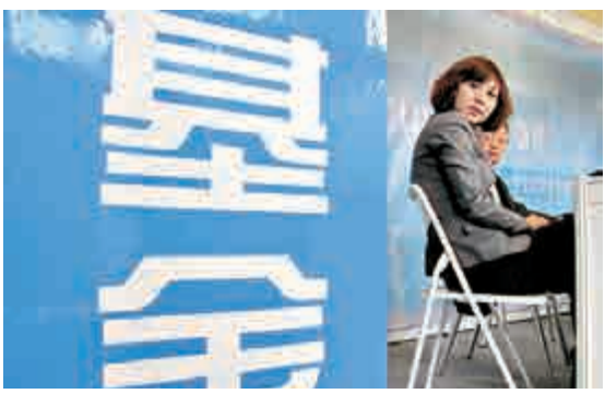
▲公募基金三季報巨虧6503億元，創單季虧損紀錄

【大公報訊】公募基金三季報披露完畢。統計顯示，各類公募季內共虧損6503億元（人民幣，下同），刷新基金季虧損紀錄。整體來看，共84家公募基金虧損，僅16家盈利。分類型來看，受股災行情拖累