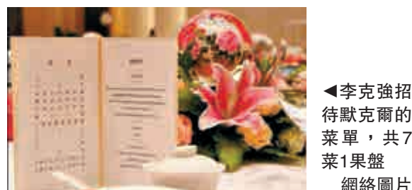
▲李克強招待默克爾的菜單，共7菜1果盤

【大公報訊】據中安在線消息：10月30日，李克強總理不僅向默克爾展示了合肥的經濟成就，還讓默克爾一飽口福，體驗了徽式美味。