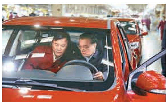
▲30日，中國國務院總理李克強到安徽江淮集團控股有限公司考察。他坐進一輛新能源汽車，還到車頭、車尾詳細詢問汽車各個零部件情況

【大公報訊】據中新社消息：國務院總理李克強10月30日在安徽省委書記王學軍、省長李錦斌陪同下，在合肥考察。他強調，要着眼未來5年乃至更長遠的發展，用創新、協調、綠色、開放、共享的發展理念