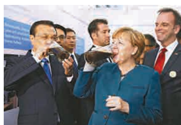
▲10月30日，李克強總理與默克爾總理共同品嚐合肥學院學生釀製的德國黑啤