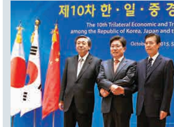
▲30日，在韓國首爾，日本經濟產業大臣林干雄（左）、韓國產業通商資源部長官尹相直（中）和中國商務部副部長鍾山握手合影

中國商務部國際貿易談判代表兼副部長鍾山、韓國產業通商資源部長官尹相直、日本經濟產業大臣林干雄出席會議，就共同關心的經貿問題深入交換意見並達成一系列共識。