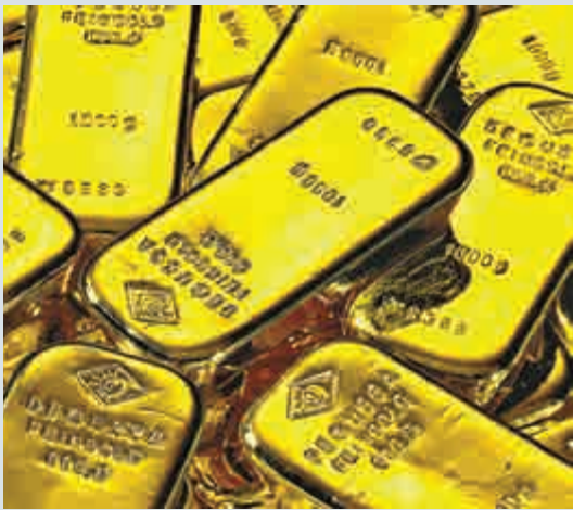
▲上月金價曾經上升，但美國聯儲局上周發出鷹派言論，觸發沽金行動

【大公報訊】金價疲軟，現貨金價周一度跌至每盎司1134.60美元，為10月5日來最低位。分析員預料，金價在每盎司1131美元的支持位受到考驗，一旦跌破，下一個支持位在1119美元。市場揣測全球經濟疲軟，驅使聯儲局推遲至明年加息，上月金價曾經上升，但美國聯儲局上周發出鷹派言論，觸發沽金行動。金市分析員表示，技術沽售推低金價，亞洲對黃金需求上周末出現升勢，但交易未見明顯反彈。亞洲以外對黃金需求仍然疲軟，10月美國金幣銷售大跌73%。而紐約金價曾跌0.1%至每盎司1140.3美元。上海黃金交易所99.99%純度金價一度跌0.8%至每克232元人民幣。投資者減少黃金持倉，SPDR黃金信託資產上周五跌0.3%至692.26噸。自上周三聯儲局出乎市場意料，表明12月會議有機會加息後，市場投機者減持黃金，交易員亦沽金，上周五金價錄得九周以來最大單周下跌。其他貴金屬價格周一下跌，現貨銀價一度跌0.45%至每盎司15.45美元，現貨鉑金價格曾跌0.415至每盎司977.7美元。