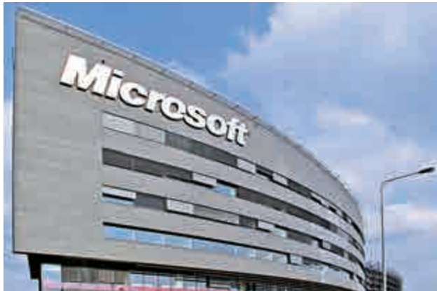
▲微軟上周四發行規模130億美元新債，趕在12月聯儲局可能加息前發債，鎖定利率

即使部分風險高的公司，發債需求亦強勁。支付科技公司First Data持有垃圾級別信貸評級，上周五稱發行34億美元債券，利率為七厘。然而，依然有一些信貸周期或見頂的跡象，垃圾評級公司的違約風險料增加，更多公司將被信貸評級機構調低評級，企業行政高層在營收增長遇到困難時，推動更多併購活動，意味部分公司債務水平加大。