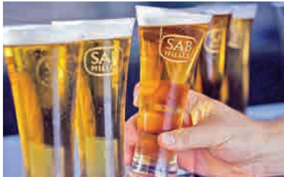
▲儘管有百威英博以高達1040億美元收購SABMiller，但10月份的併購活動仍然偏低

今年來已經宣布併購交易規模接近四萬億美元，估計2015年可超越2007年的歷史紀錄。2007年信貸泡沫產生4.3萬億美元交易規模。對前景看法悲觀的銀行家稱，一旦超級併購交易減少，整個市況料會急劇改變，但仍然不想形容為併購潮結束。一名美林美銀環球併購主管表示，隨着經濟環境依然有利交易活動，企業的策略行動繼續強勁，料會持續到明年。