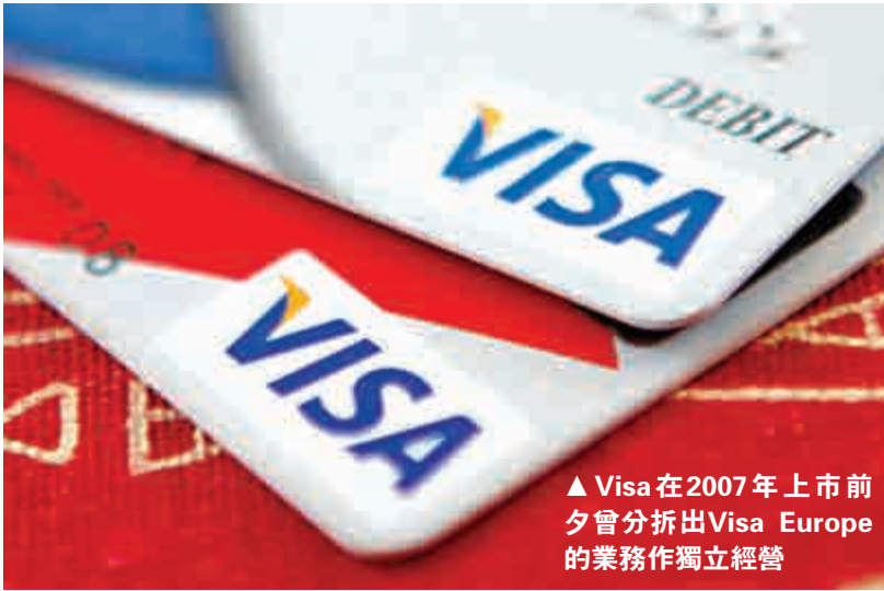
▲Visa在2007年上市前夕曾分拆出Visa Europe的業務作獨立經營

然而，根據Atlantic Equities的分析員包括Chris Hickey等認為，兩家公司亦可能為Visa帶來短暫性危機，令萬事達卡受惠，原因是Visa將於交易完成後加價。