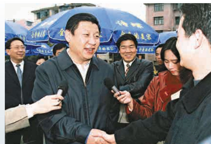
▲長年的涉台工作經驗，令習近平對台灣有着非常深入的了解。圖為2002年時任福建省省長習近平視察福州節日市場，並看望因群眾和 downwards 職工

也是在此次會見中，習近平提出「願意首先同台灣同胞分享大陸發展的機遇」；今年5月習朱會期間，習近平再次明確表示，「我們願意首先同台灣同胞分享發展機遇，願意優先對台灣開放，並且對台灣同胞開放的力度要更大一些。」習近平還闡明了在維護台資企業合法權益、台灣參與區域經濟合作等問題上的積極立場。這些都充分展現了習近平的民本情懷，體現了大陸改革發展紅利更多惠及台灣同胞的誠意和善意。