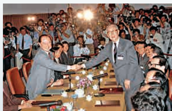
▲1993年4月，在「九二共識」基礎上，兩岸兩會領導人「汪辜會談」在新加坡舉行，會談取得積極成果

1949年以來，兩岸從激烈軍事衝突，到長期尖銳政治對峙，直到1980年代末才打破隔絕堅冰。1992年，海協會與台灣海基會達成兩岸各自以口頭方式表述「海峽兩岸均堅持一個中國的原則」的共識，即「九二共識」。