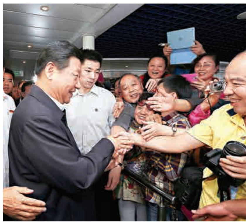
▲2014年11月1日，習近平在福建調研時，登上「海峽號」高速客輪與赴台的兩岸旅客握手交流