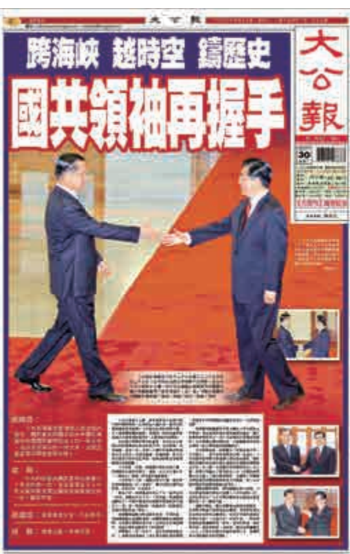
▲二〇一五年四月三十日，大公報頭版報道中國共產黨總書記胡錦濤與中國國民黨主席連戰跨越七十年的握手

同年6月，新任海協會會長陳雲林與海基會董事長江丙坤在北京釣魚台賓館舉行會談，中斷了近十年的兩會協商談判正式恢復。11月，海協會會長陳雲林首次訪台，也是兩會領導人會談首次在台舉行，達成多項實質性協議。12月，兩岸空運、海運直航和直接通郵啓動，標誌著兩岸全面「三通」基本實現。2010年6月，海協、海基兩會完成ECFA的簽署，開啓了兩岸經濟合作的新階段。