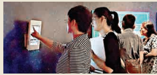
▲觀眾通過各種互動遊戲了解航海貿易詳情