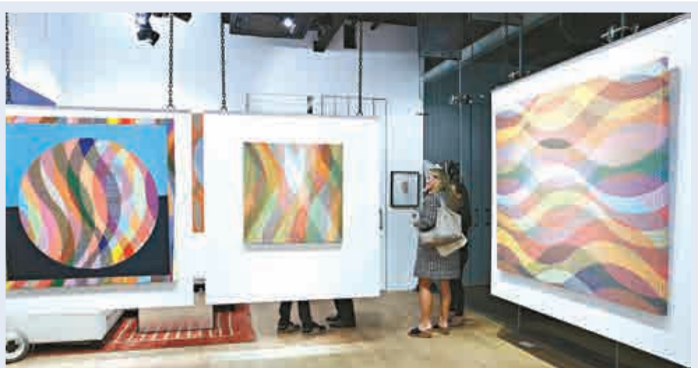
▲「抽象幾何」展覽現場

查詢展覽詳情可電二八〇三〇三三二，或瀏覽紅門畫廊網頁： www.puerta-roja.com 。