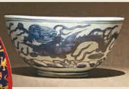
▲「南澳一號」沉船出水的青花雙龍趕珠紋碗