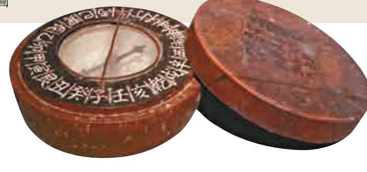
▲廣東省博物館藏的清代航海羅盤

明清時期，龍紋一般作為皇族專用，多是五爪龍；民間也有在陶瓷器上使用龍紋圖案作為裝飾，通常是三爪龍。講解員說「南澳一號」船艙貨物的裝載以提高裝載量為出發點，大的陶罐內裝填以小碟、小罐、小杯、棋子、串飾等小物品以及水果等食物，因此這個甕不是出口產品，而是儲物器。該展覽展期至明年三月二十日。