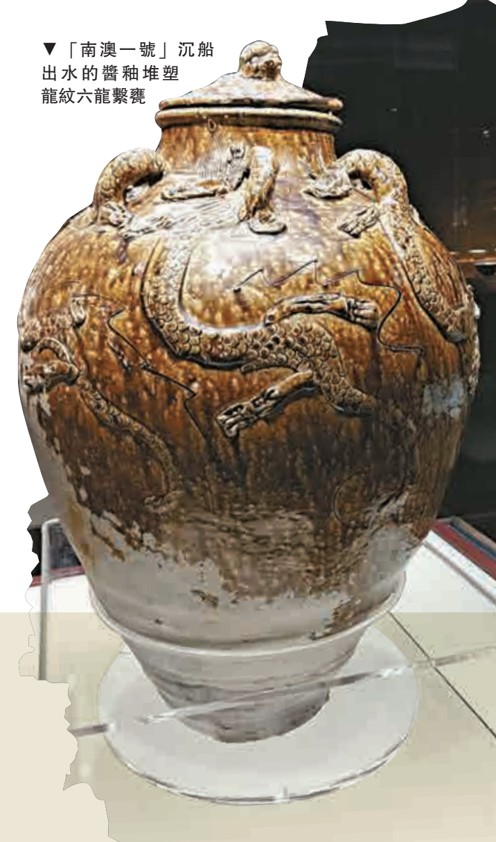
▼「南澳一號」沉船出水的醬釉堆塑龍紋六龍繫甕