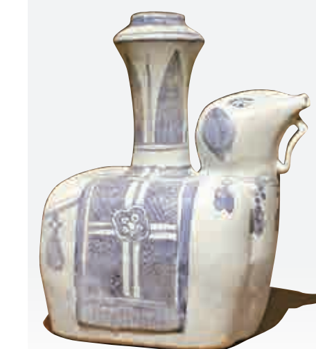
▲「萬曆號」沉船出水的青花象首軍持

」位置是恆定的特點，用它們來幫助船隊在大海中判定方向和所在位置，這種方法叫「過洋牽星術」，這也是本次展覽名字的由來。