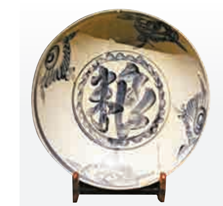
▲「南澳一號」沉船出水的青花「糧」字大盤，此類大盤是「南澳一號」沉船出水文物之大宗