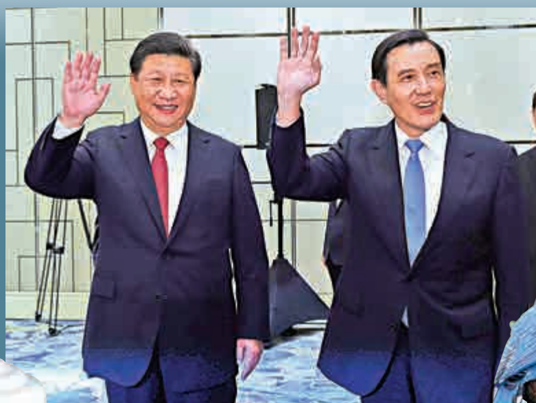
▲兩岸領導人習近平、馬英九七日在新加坡舉行會面