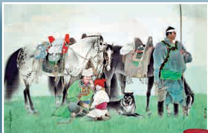
▲習贈馬劉大為畫作。圖為其代表作品《馬背上的民族》 ▲台灣媒體稱「習馬會」晚宴上也飲了茅台