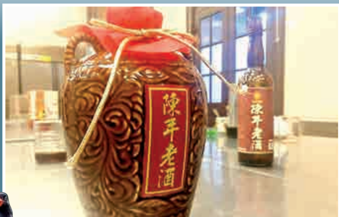
▲馬英九攜帶馬祖老酒赴宴 ▲藍鵲是很有家庭觀念的群聚動物，象徵兩岸一家親