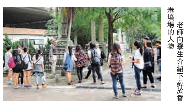
老師向學生介紹下葬於香港墳場的人物

古老的墳場猶如一座歷史寶庫，下葬者有知名的大人物，亦有不見經傳的無名之輩；有些為作戰而犧牲，有些因公殉職，亦有感染疫病致死。從墓碑上的刻字可知他們的身份和死因，從而聯想那些年的生活。墓穴埋藏着一個個故事，串連起來便是一段歷史。除了軍政人員外，當年能在香港墳場佔一席位的大都是富有或精英人士，絕大部分為基督徒。華人墳墓不多，只有百餘人，但信奉神道和佛教的日本人卻爭取到墳場一角作為墓葬區，據統計達四百六十五人。